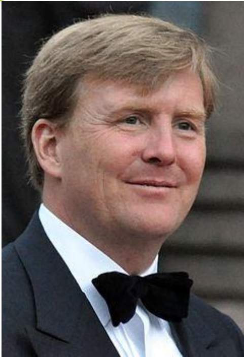
Виллем-Александр 7-й Король Нидерландов

“Социального государства 20 века больше не существует”.