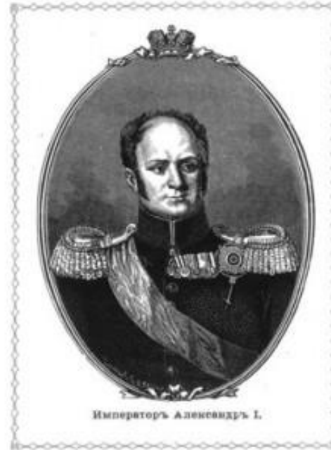
Императоръ Александръ I.

О быкновенное подавiе нищихъ, умножая только число оныхъ, не упокоютъ старца, отягощеннаго лѣтами, не возвратитъ здоровья юношѣ, увядающему на зарѣ дней своихъ, не избавитъ отъ смерти или порока младенца, долженствующаго быть подпорою отечества. Не рѣдко также наглый туземецъ похищаетъ отъ руки благотѣльной то, что назначено было отцу сенебства, томившемуся на одрѣ смерти и отчаянiя. Изъ сего слѣдуетъ, что растроганнѣе быть иужонѣе и весьма часто обманчивѣе видомъ нищеты и убожества, не есть еще благодѣянiе. Надлежитъ искать несчастныхъ въ самомъ жилищѣ ихъ—въ сей обители плача и страданiя. Ласковымъ обращенiемъ, спасительными совѣтами, словомъ всѣми нравственными и физическими способами стараться облегчить