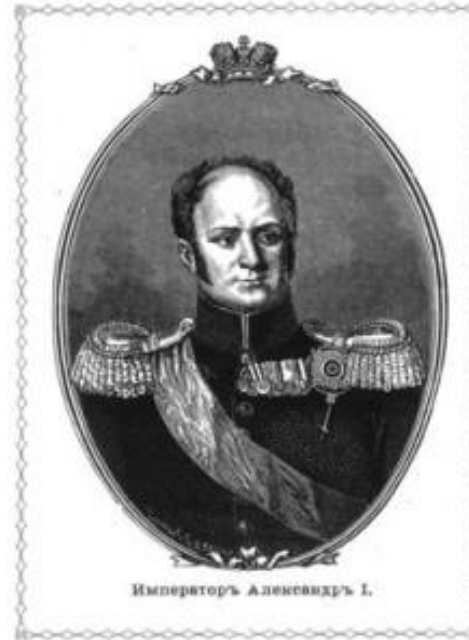
Императоръ Александръ I.

О быкновенное подавiе нищихъ, умножая только число оныхъ, не упокоютъ старца, отягощеннаго лѣтами, не возвратитъ здоровья юношѣ, увядающему на зарѣ дней своихъ, не избавитъ отъ смерти или порока младенца, долженствующаго быть подпорою отечества. Не рѣдко также наглый туземецъ похищаетъ отъ руки благотѣльной то, что назначено было отцу сенебства, томившемуся на одрѣ смерти и отчаянiя. Изъ сего слѣдуетъ, что растроганнѣе быть иужонѣе и весьма часто обманчивѣе видомъ нищеты и убожества, не есть еще благодѣянiе. Надлежитъ искать несчастныхъ въ самомъ жилищѣ ихъ—въ сей обители плача и страданiя. Ласковымъ обращенiемъ, спасительными совѣтами, словомъ всѣми нравственными и физическими способами стараться облегчить