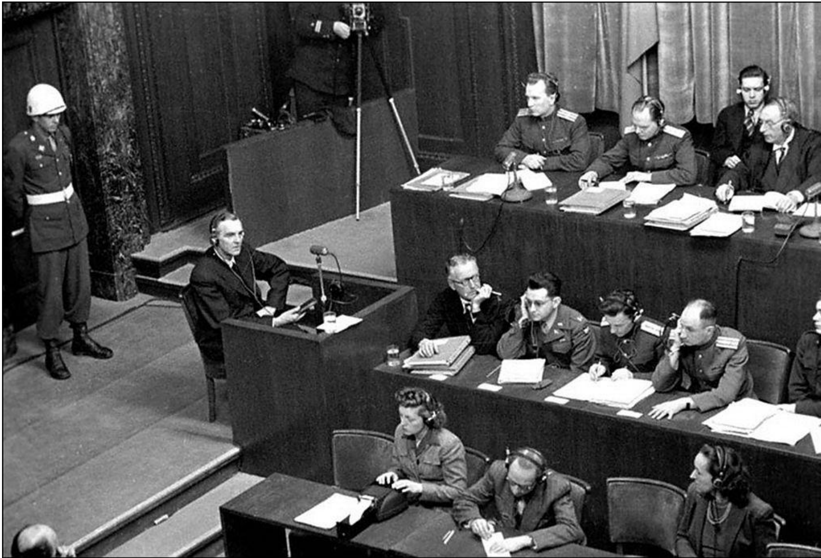
Фридрих Паулюс свидетельствует на Нюрнбергском процессе