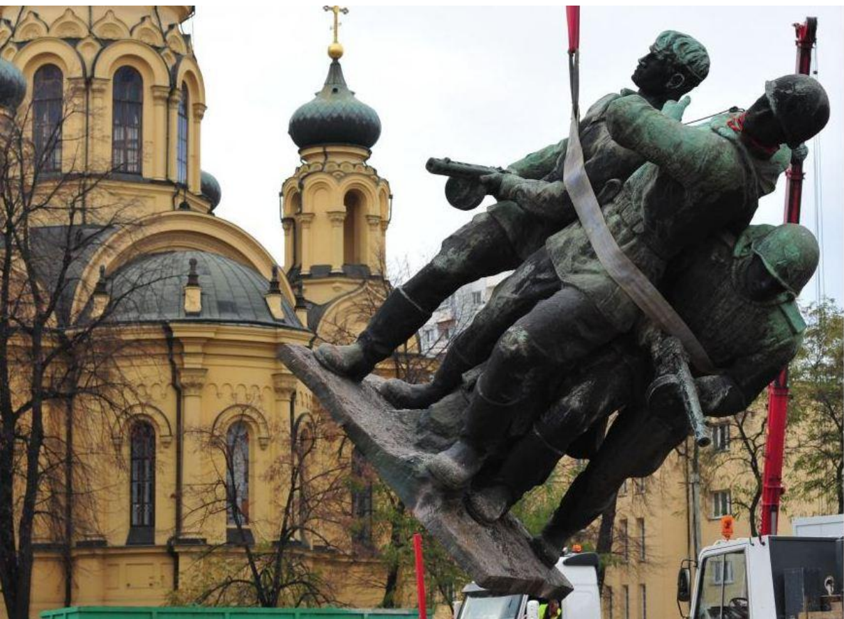
Снос памятника героям войны – Польше