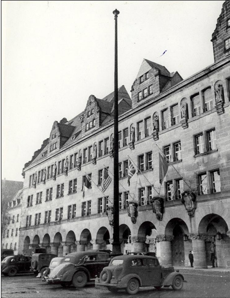
Здание суда, где проходили заседания Международного суда над военными преступниками