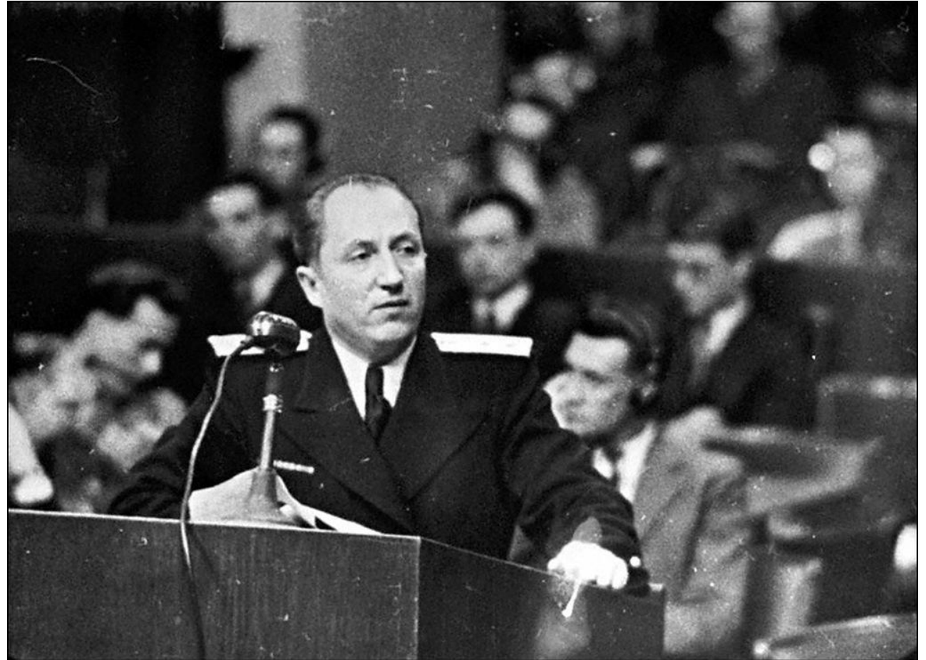
Главный обвинитель от СССР на Нюрнбергском процессе Руденко Р.А.