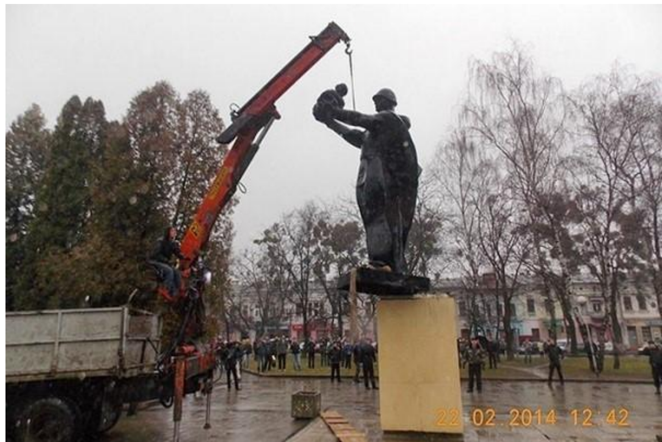
Снос памятника «Воину-освободителю» - Украина