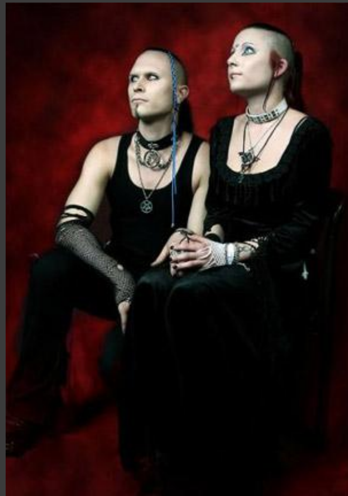
Androgyn Goth (бесполость)