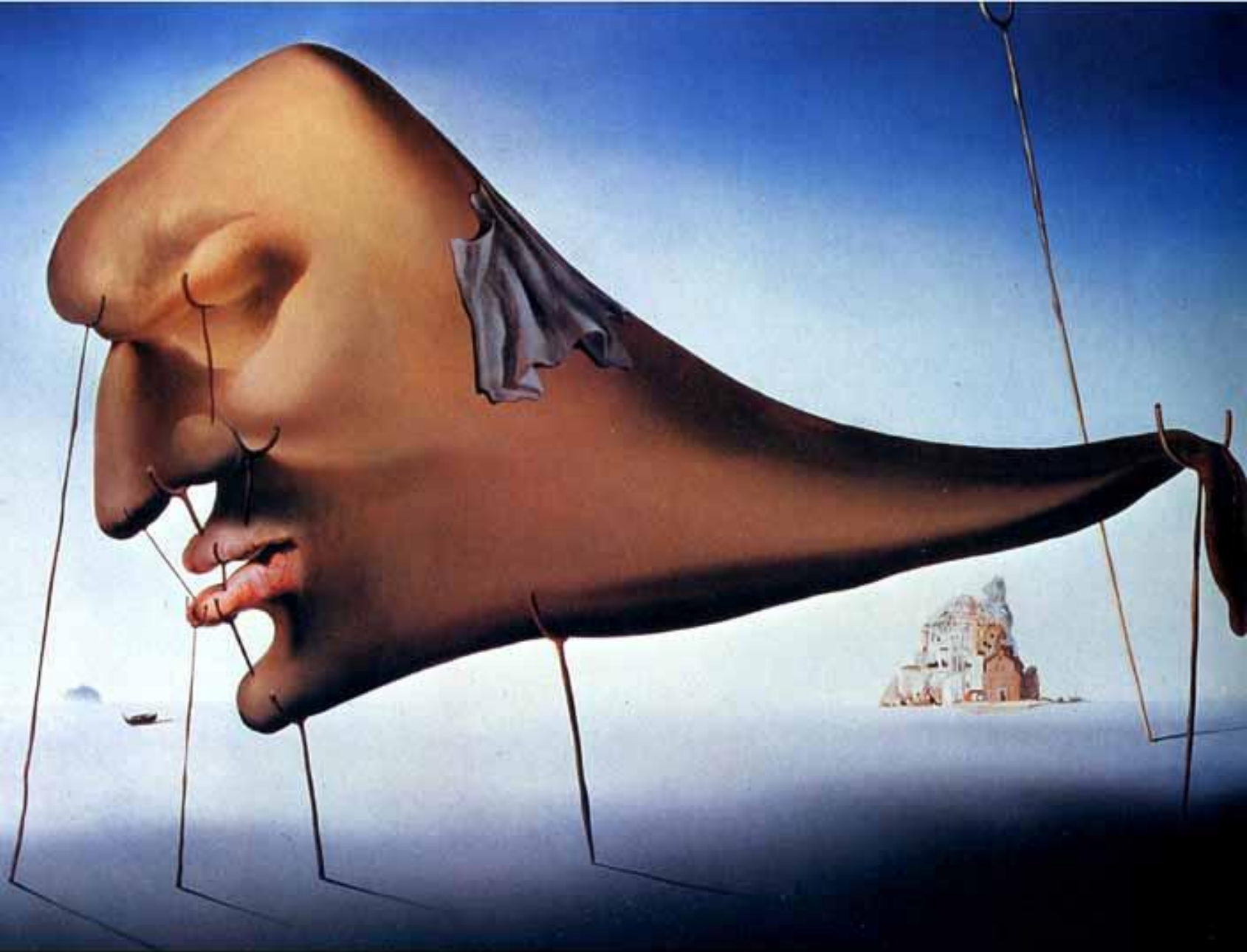
Сон, 1937. холст,масло.