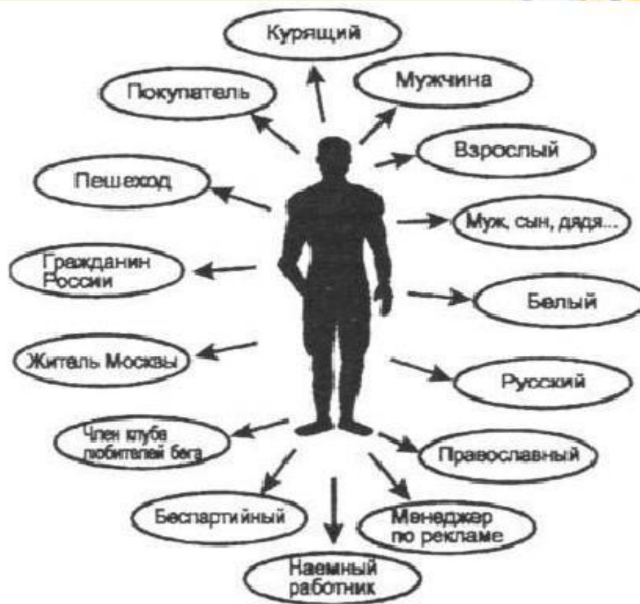
Статусный набор (портрет) человека

Статусный набор - совокупность всех статусов данного индивида.