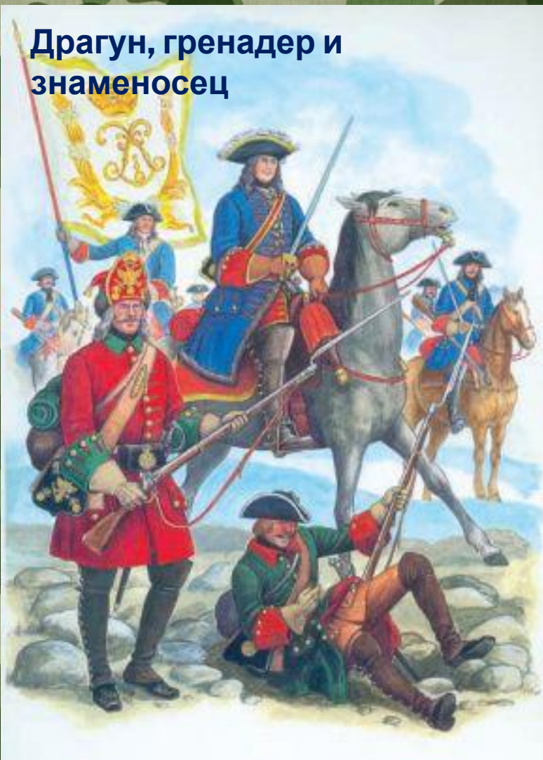
Драгун, гренадер и знаменосец