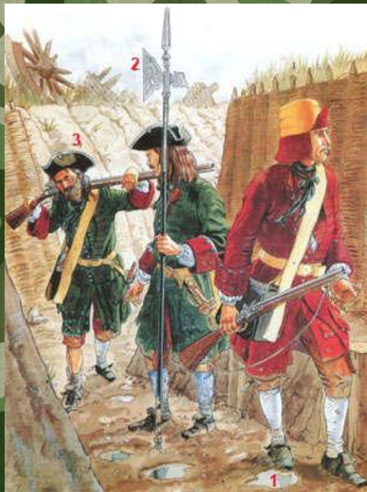
1 - фузилер Бутырского полка 2 - унтер-офицер Ингерманландского полка 3 - фузилер Псковского полка