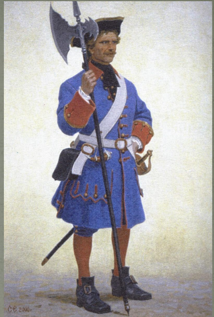
Сержант Санкт-Петербургской полиции. Начало XVIII века.

Кроме того, полиция обладала полномочиями судебной инстанции и имела возможность назначать наказания по уголовным делам.