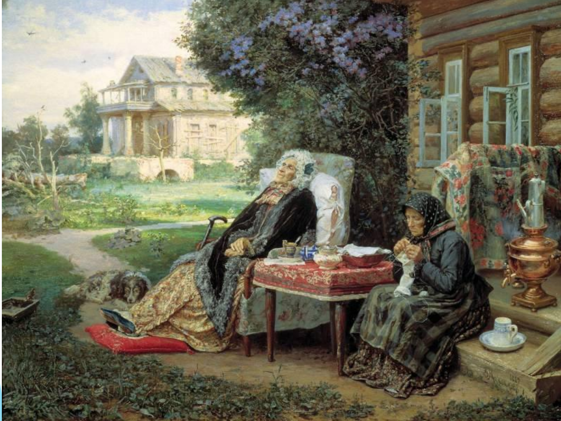
В.М. Максимов «Все в прошлом» (1899)