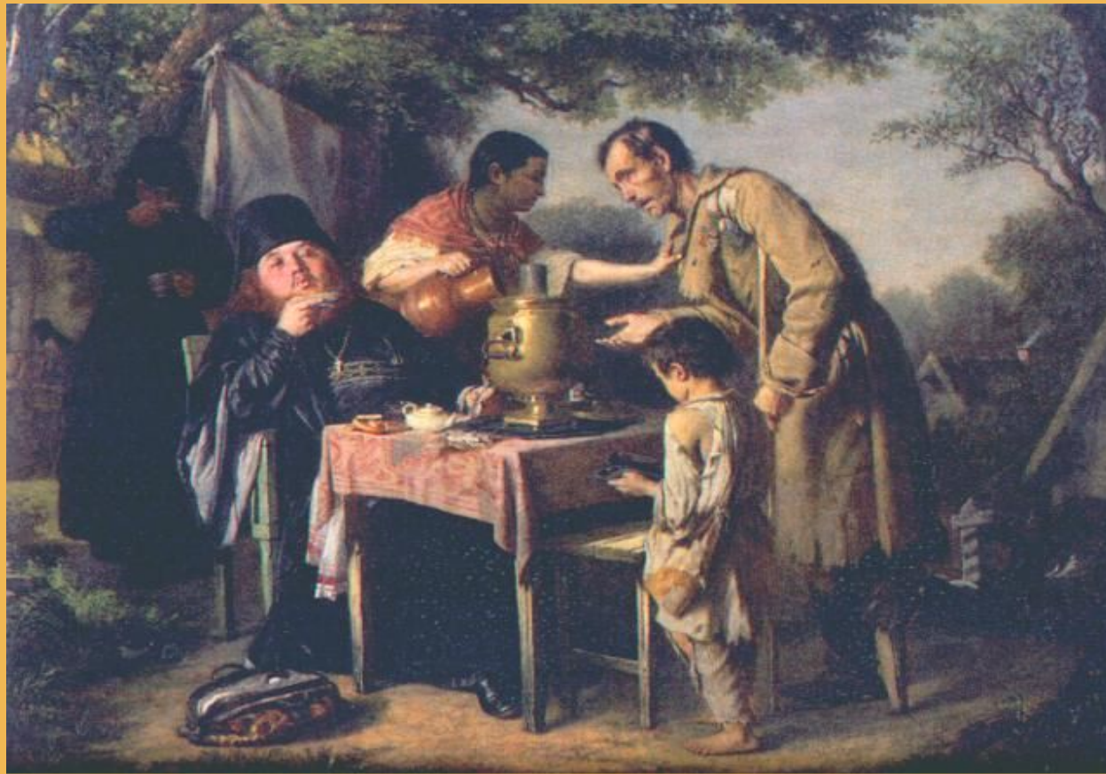
В.Перов. Чаепитие в Мытищах.

Можно ли назвать людей изображенных на картине самостоятельными?