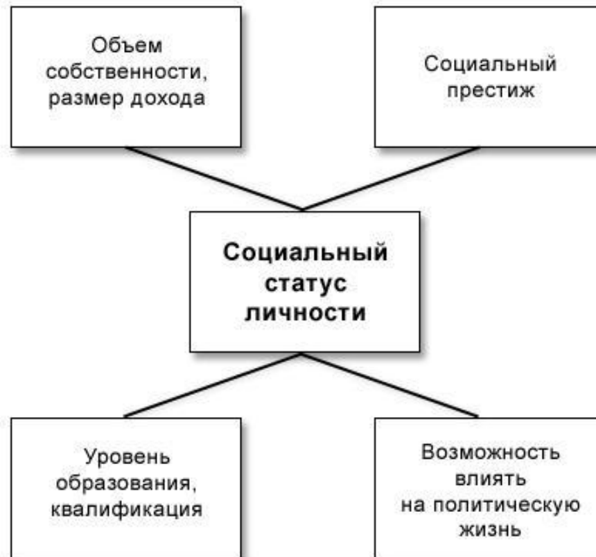
Схема: Из чего складывается социальный статус