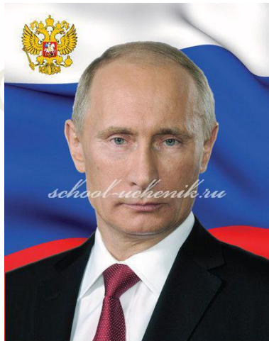
ПРЕЗИДЕНТ РОССИЙСКОЙ ФЕДЕРАЦИИ ПУТИН ВЛАДИМИР ВЛАДИМИРОВИЧ