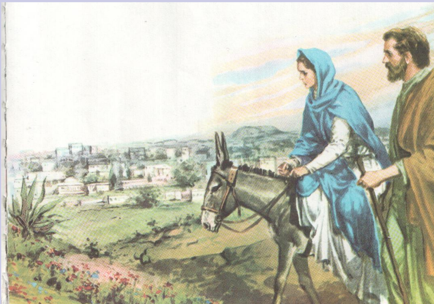
Путь в Вифлеем