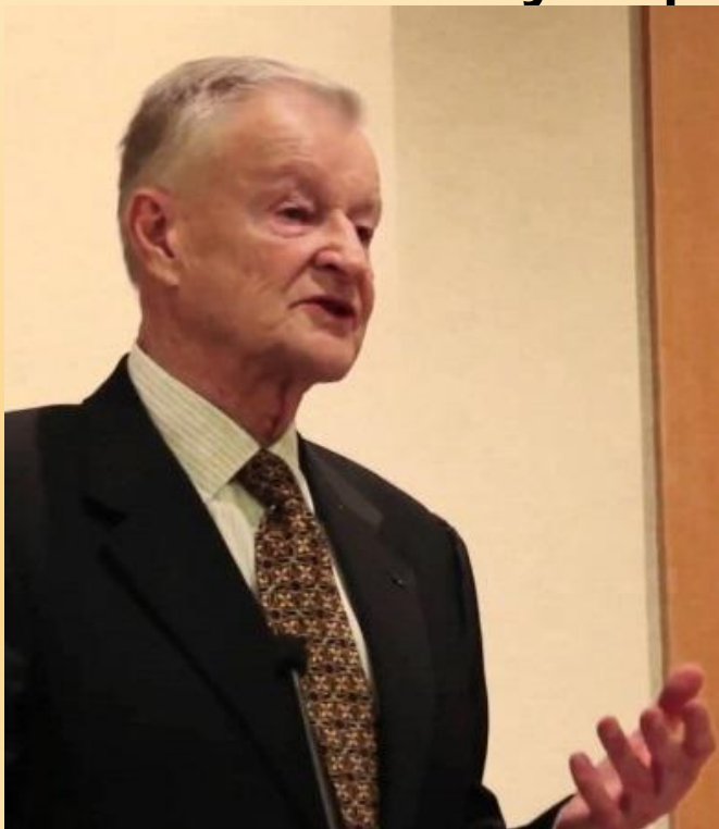
Збигнев Бжезинский, американский политолог.

«Если Рим дал миру право, Англия – парламентскую деятельность, Франция – культуру и республиканский национализм, то современные США дали миру научно-техническую революцию и массовую