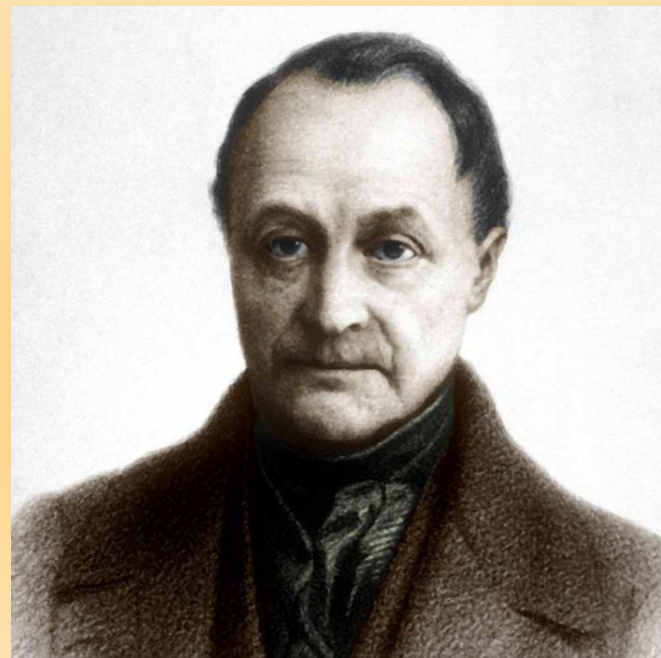
Основоположник позитивизма О. Конт

Идейная основа современной массовой культуры - философия позитивизма. Позитивизм проявился как натурализм, для него характерно сведение социального к биологическому и стремление любыми путями увести реципиента от противоречий реального мира, объявить их несуществующими или заставить о них забыть. В рамках позитивистской концепции реанимируется и так называемый «культ казенного оптимизма» и «американской мечты».