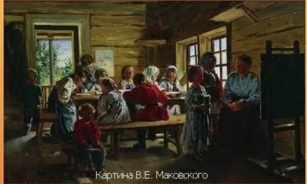
Картина В.Е. Маковского