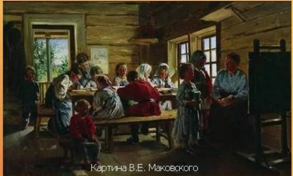
Картина В.Е. Маковского