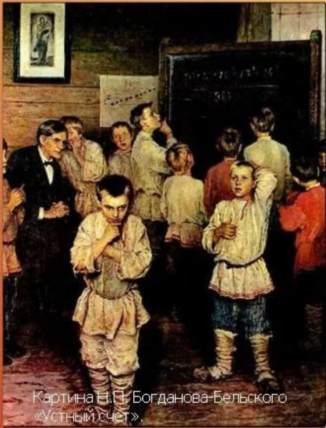
Картина Н.П. Богданова-Бельского «Устный счет».

Гравюра из «Азбуковника» Бурцева (1637 г.)