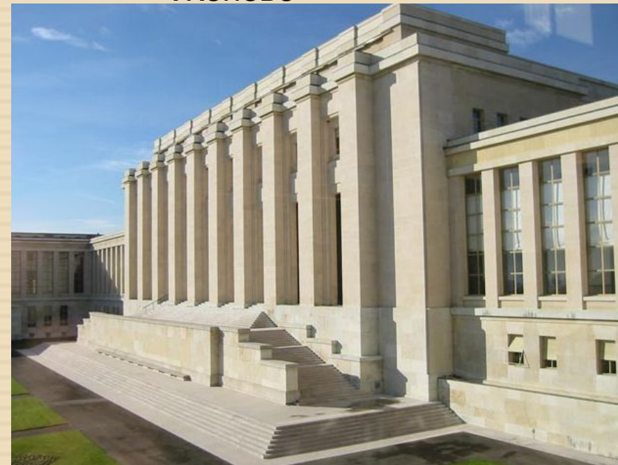
Здание ООН в Женеве