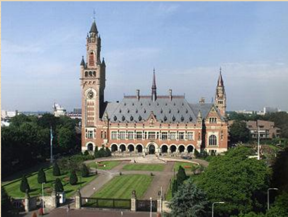
Дворец Мира, Гаага