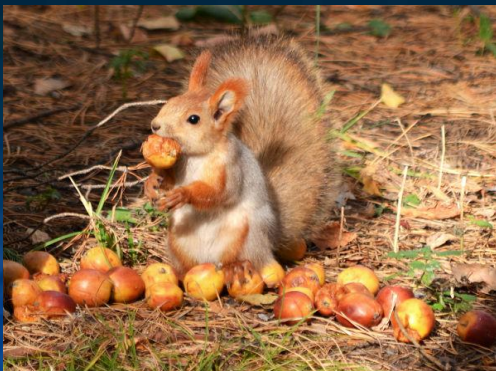
5. Белка делает запасы