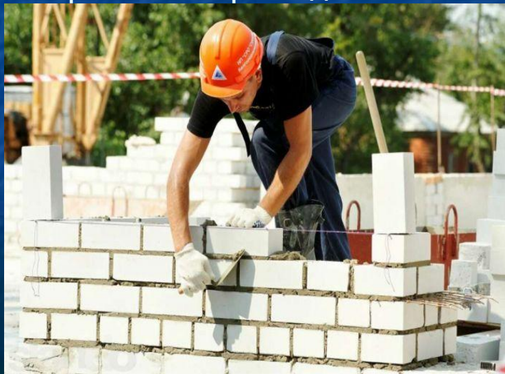
7. Строитель строит дом