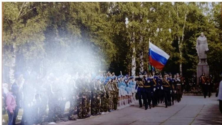
Захоронения останков в г. Ладога

Поисковые экспедиции по захоронению останков воинов Великой Отечественной войны