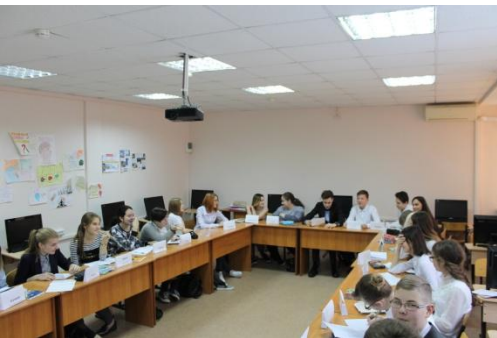
«Суд» на уроке права в 10 классе

моделирование разных судебных процессов с распределением ролей