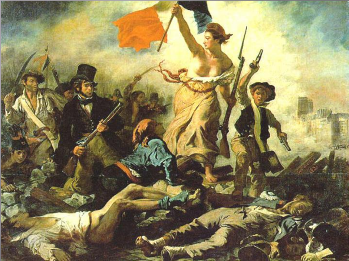
Свобода, ведущая народ, 1830 Эжен Делакруа