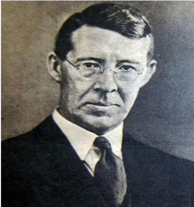
Сорокин Питирим Александрович (1889-1968)

Способы перемещения в социальной структуре общества называют «СОЦИАЛЬНЫЕ ЛИФТЫ» .