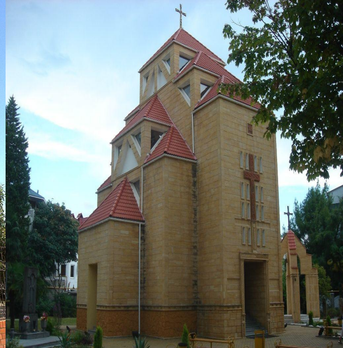
Собор Святого Сергия в Сочи