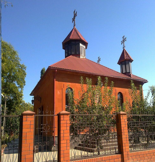
Церковь Святого Сергия в Славянске-на- Куба