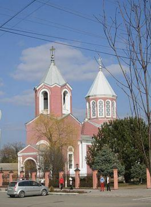
Церковь Пресвятой Богородицы, Армавир осн. 1840 г.