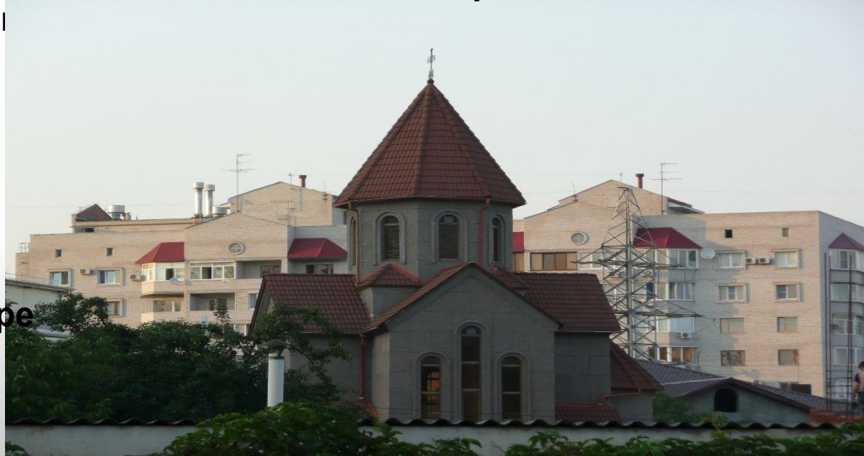
Церковь в Краснодаре