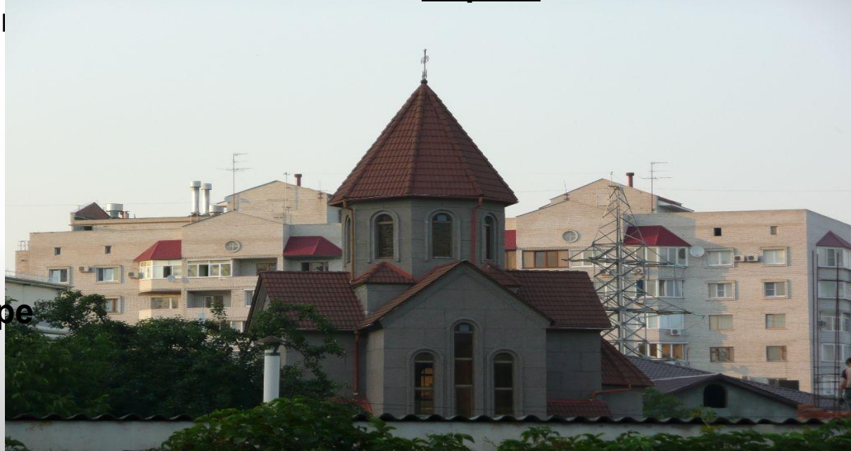
Церковь в Краснодаре