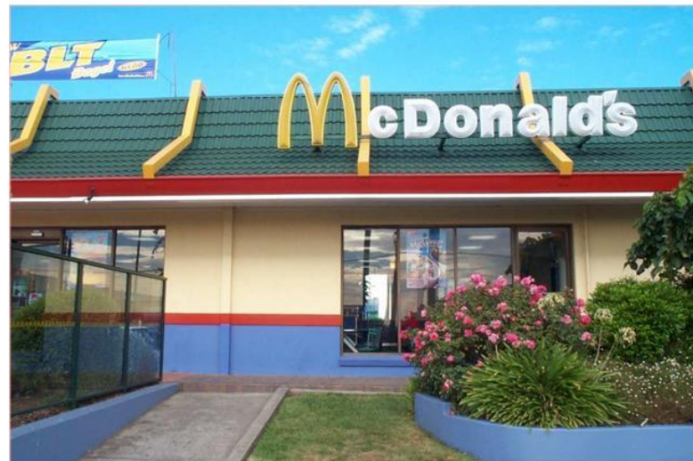
Самый известный ресторан быстрого питания – McDonald's.