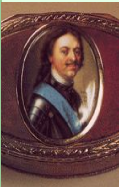
Петр I (холерик)