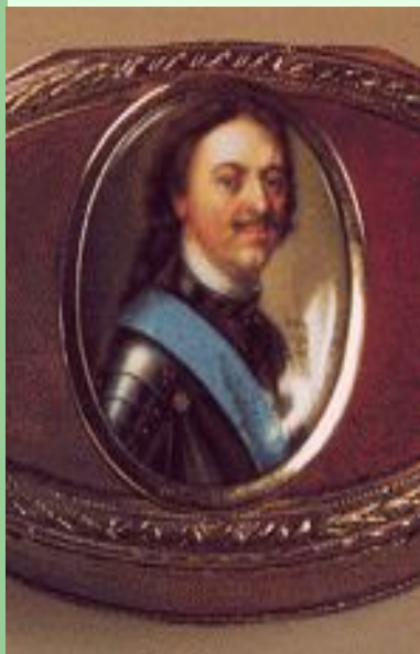
Петр I (холерик)