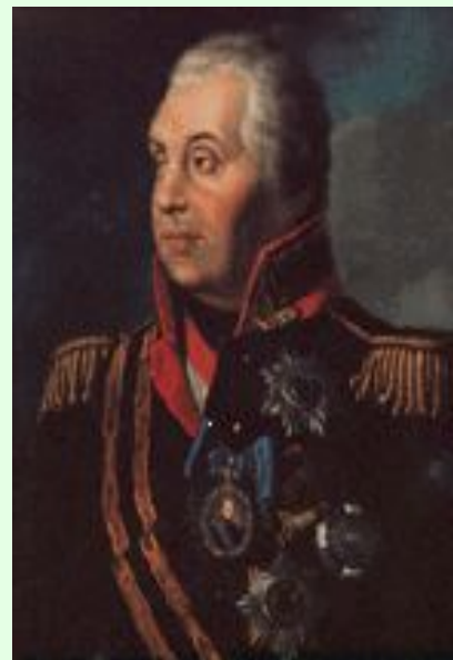
М.И. Кутузов (флегматик)