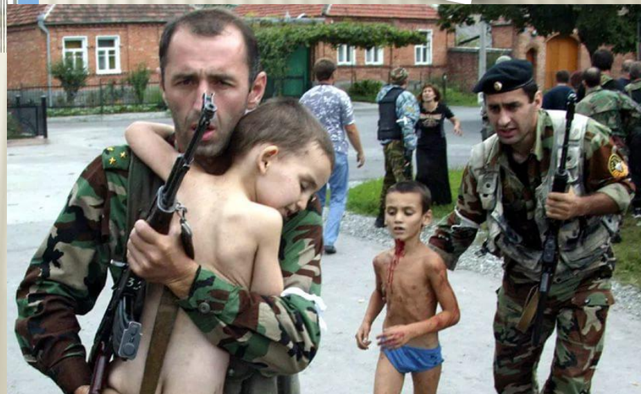
Теракт сентябрь 2004 в г.Беслан