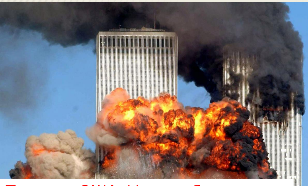
Теракт в США 11 сентября в 2001г.