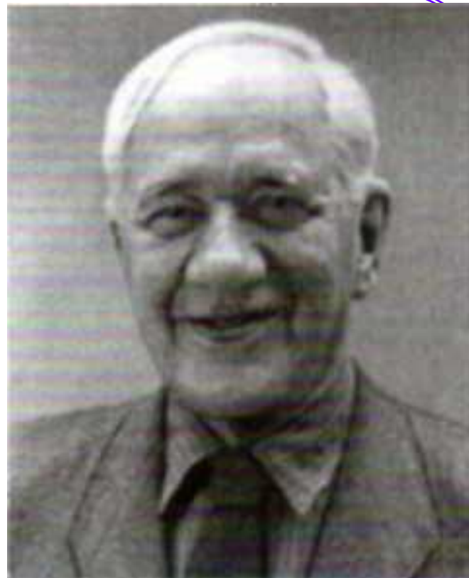
Корней Иванович Чуковский

Прочитайте материал параграфа № 12, стр. 101- 102 и ответьте на вопрос: Как вы понимаете слова К.И. Чуковского: «Быть с молодыми – наш радостный долг»?