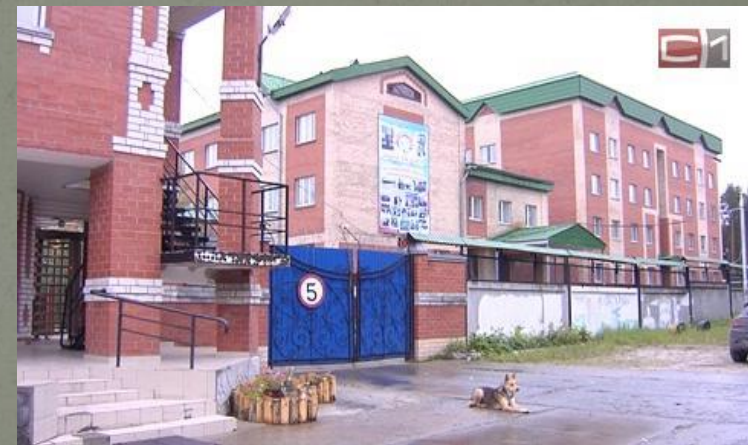
Спецшкола закрытого типа г. Сургут