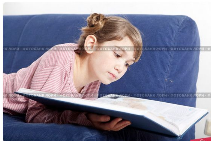
Девочка читает книгу лежа на диване