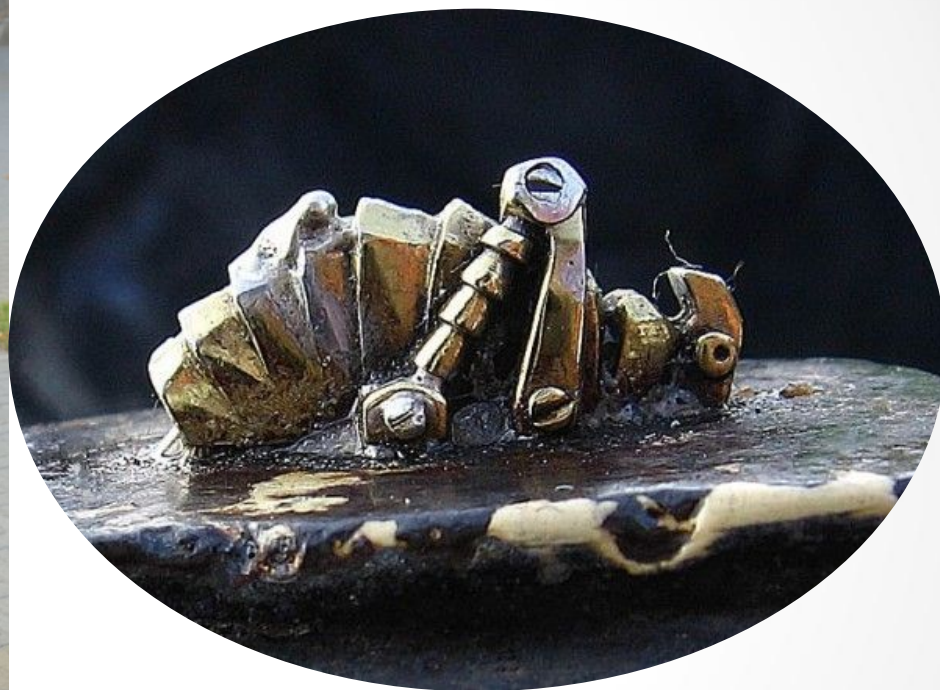
• Памятник Левше