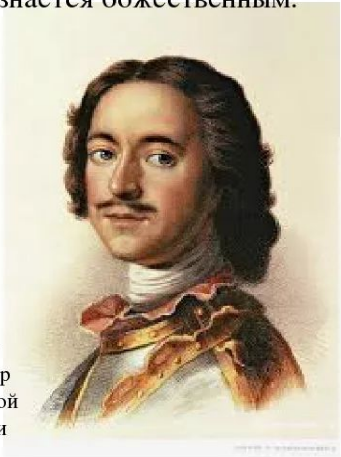
Пётр I – император Российской империи