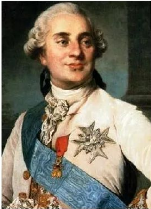
Людовик XVI – король Франции

В абсолютной монархии вся полнота власти – законодательной, исполнительной, судебной – сосредоточена в руках монарха, а ее происхождение признается божественным.