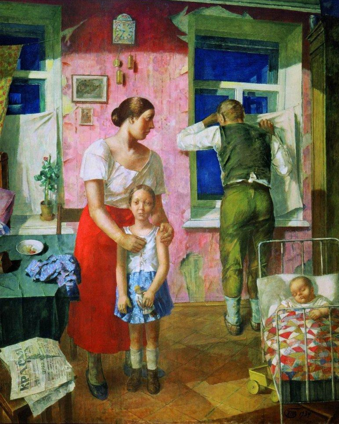
К.С. Петров – Водкин « 1919 год. Тревога» (1934 г)