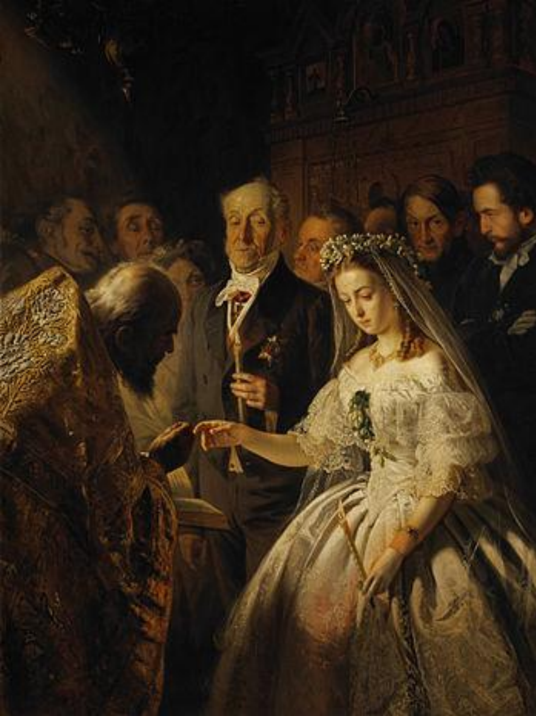
В.В. Пукирев «Неравный брак» (1862 г)