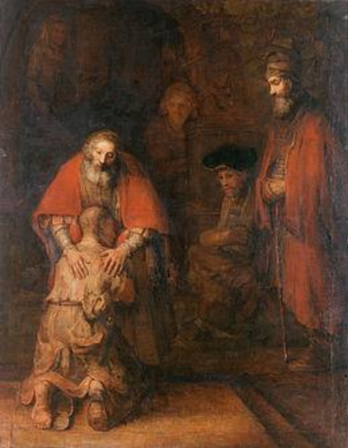
Рембрандт Харменс Ван Рейн «Возвращение блудного сына» (1669 г)