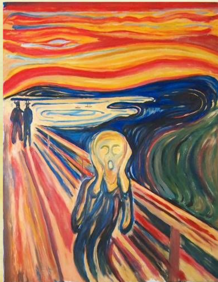
Э. Мунк. Крик