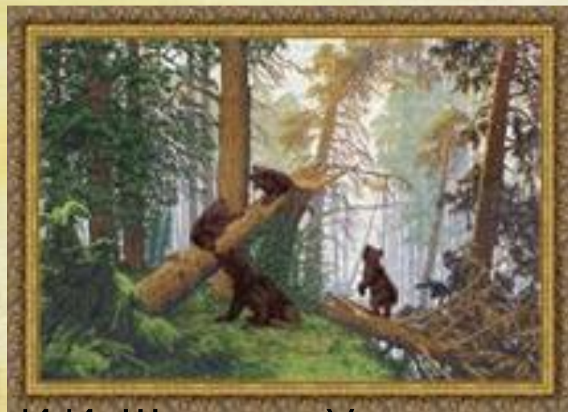
И.И. Шишкин «Утро в сосновом лесу»