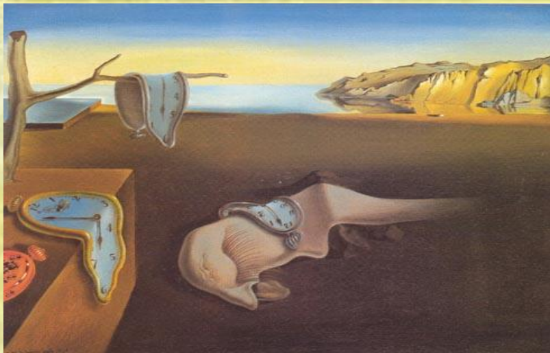
С.Дали «Постоянство памяти»