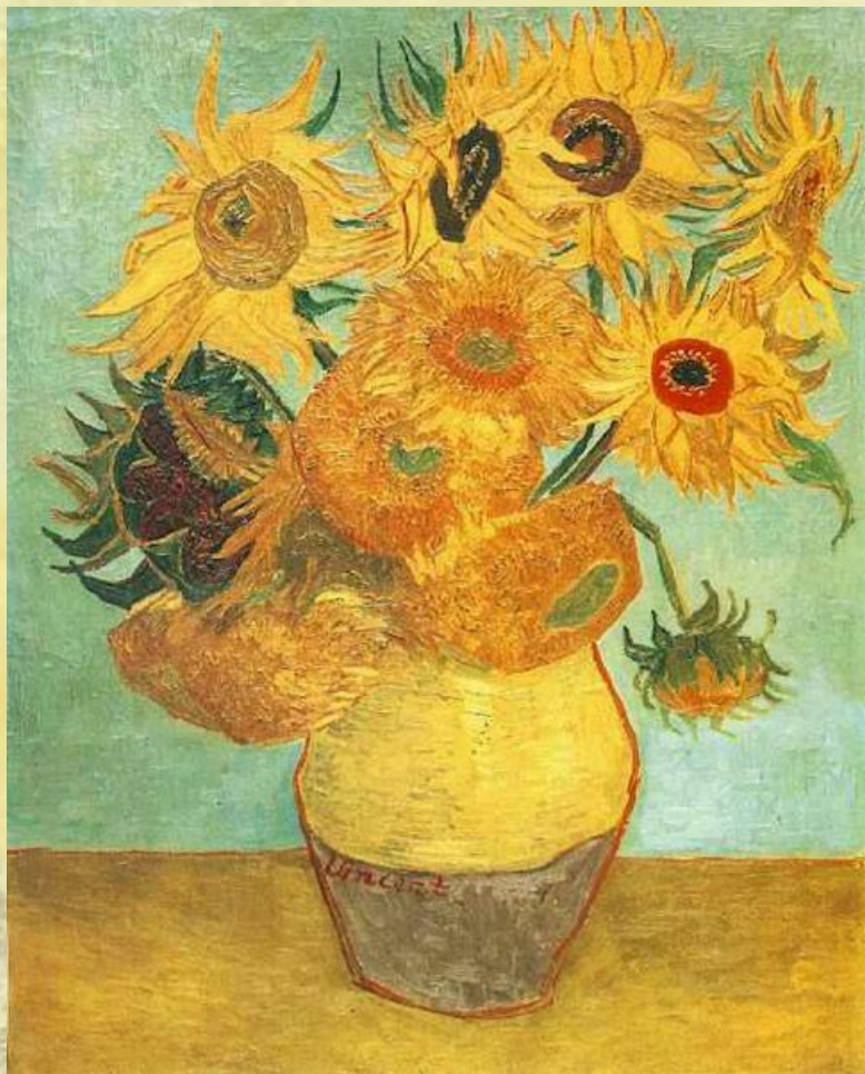
В. Ван Гог, Подсолнухи

Живопись - вид изобразительного искусства, художественные произведения, которые создаются с помощью красок, наносимых на какую-либо твёрдую поверхность.