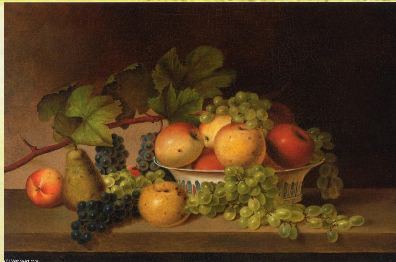
П.П. Рубенс Натюрморт.