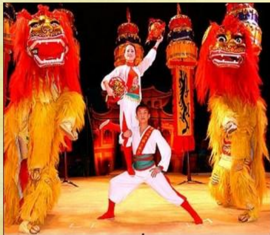
Национальный цирк КНР