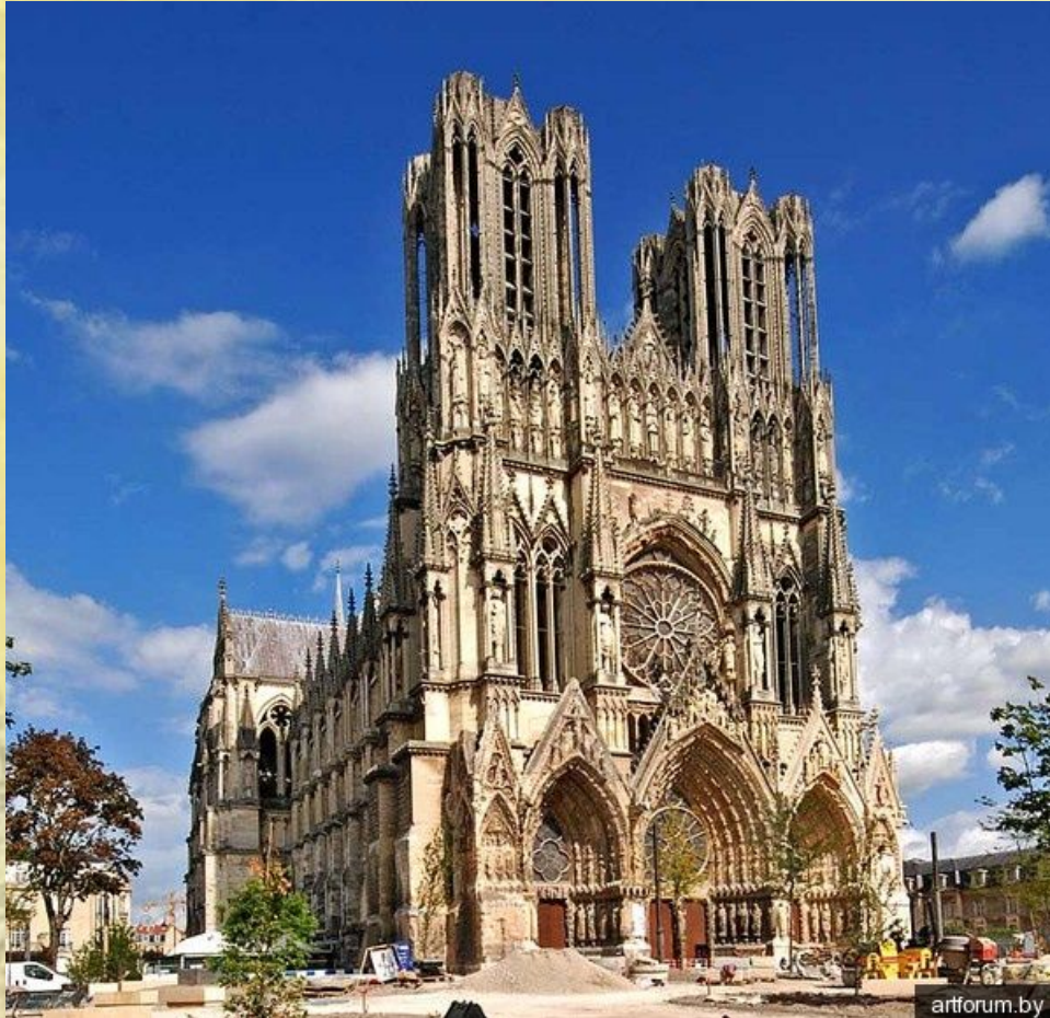
Нотр-Дам де Реймс

Архитектура — искусство проектировать и строить здания и другие сооружения (также их комплексы), создающие материально организованную среду, необходимую людям для их жизни и деятельности.