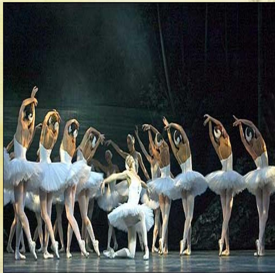
П.И. Чайковский «Лебединое озеро».