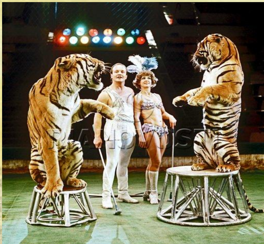
Артисты Большого Московского Государственного цирка

Цирк — искусство акробатики, эквилибристики, гимнастики, пантомимы, жонглирования, фокусов, клоунады, музыкальной эксцентрики, конной езды, дрессировки животных.