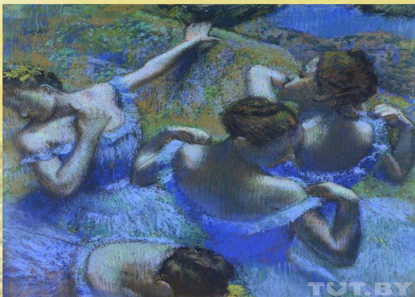
Э.Дега «Танцовщицы в голубом»