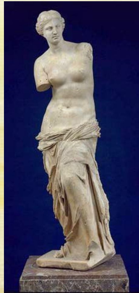
Статуя Афродиты (Венеры).