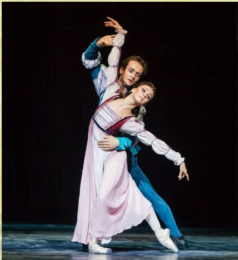
Балет «Ромео и Джульетта».

Балет - вид искусства, содержание которого раскрывается в танцевально-музыкальных образах.