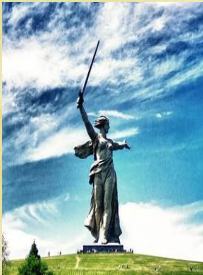
Статуя работы Вучетича Е.В. «Родина- Мать зовет»

Скульптура - вид изобразительного искусства — создание объемных изображений (статуй, бюстов, барельефов и т. п.) путем лепки, высекания, резания или отливки; ваяние.