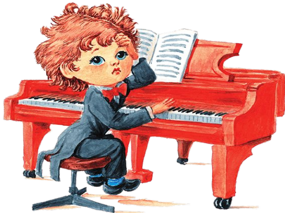
Композитор сочиняет музыку