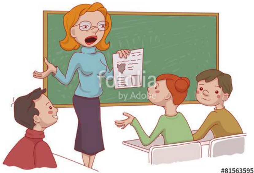
Учитель ведет урок