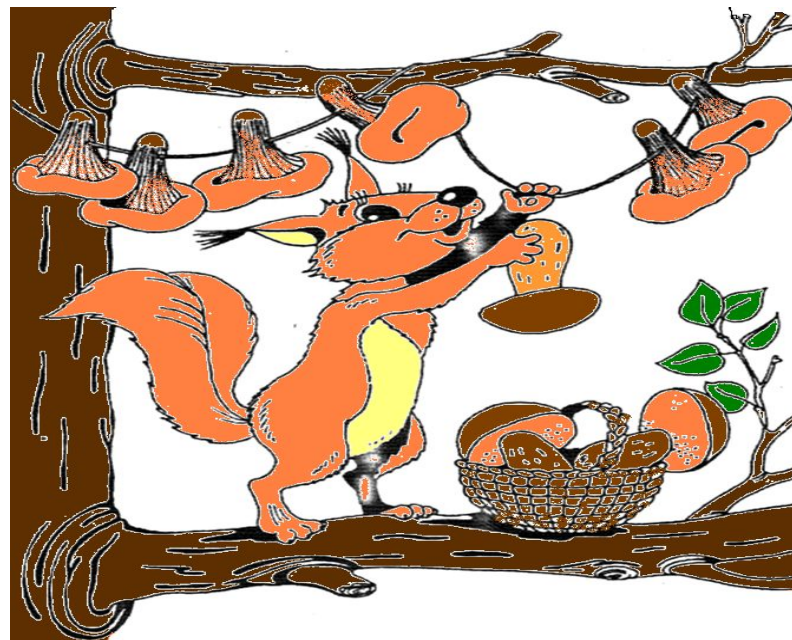
Белка делает запасы на зиму