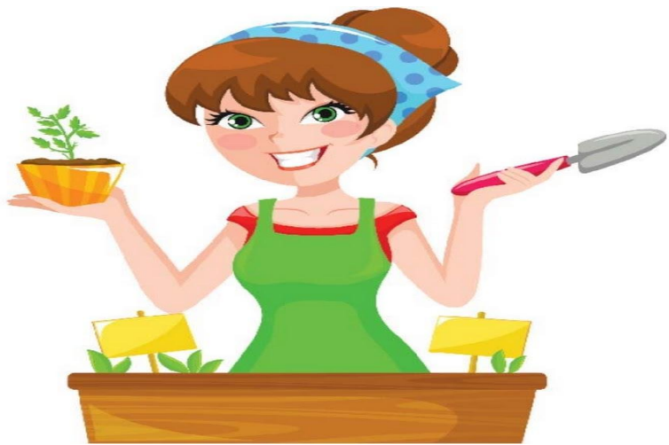
Мама сажает цветы