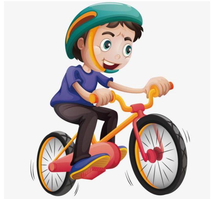
Мальчик катается на велосипеде