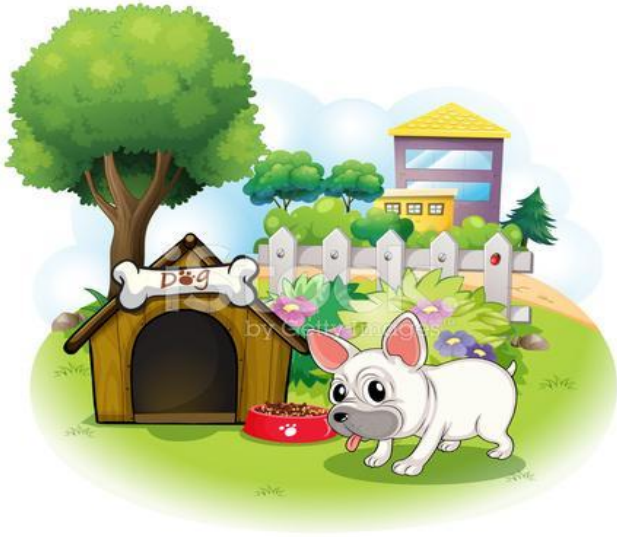
Собака сторожит дом