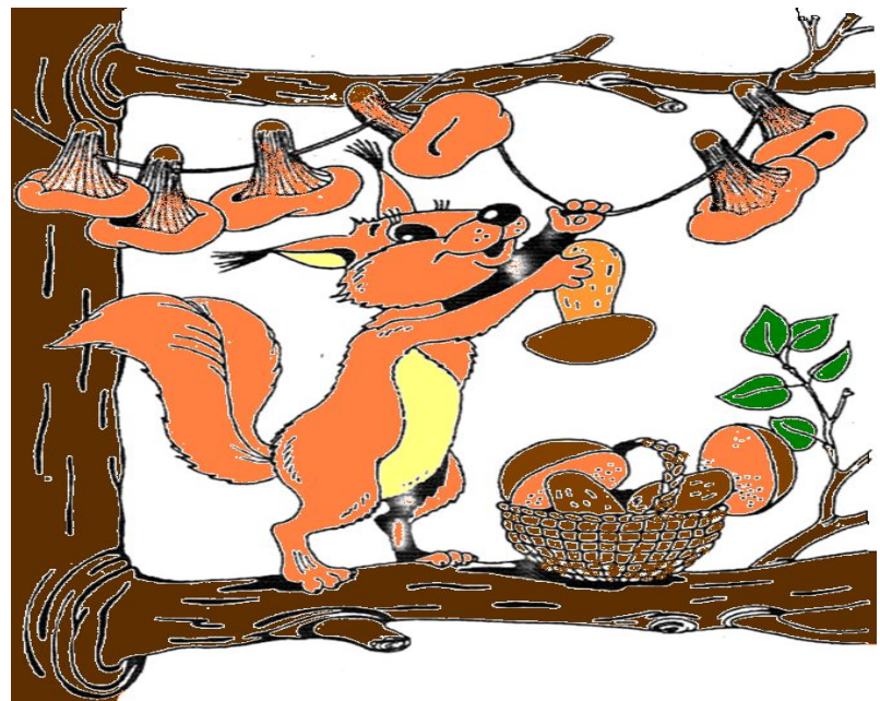
Белка делает запасы на зиму