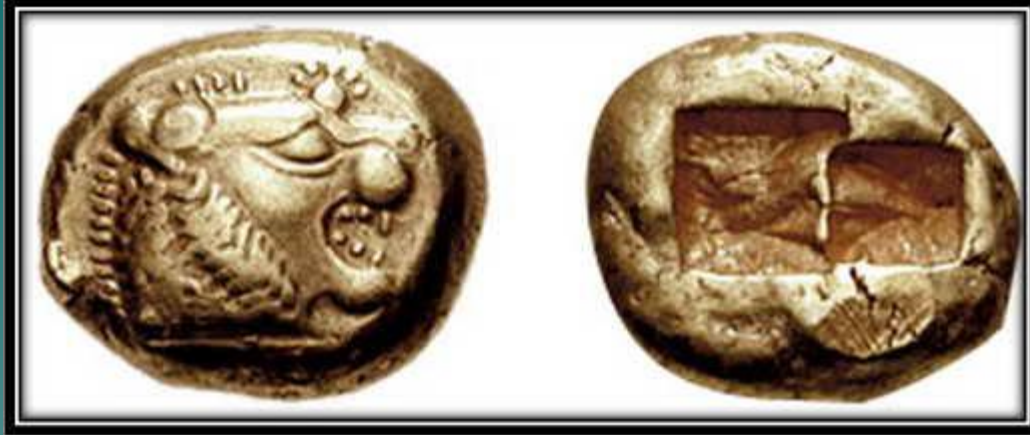
Лидийская монета VI века до н. э.

Значительно расширил территорию Лидийского царства, подчинив греческие малоазийские города (Эфес, Милет и др.) и захватив почти всю западную часть Малой Азии до реки Галис.