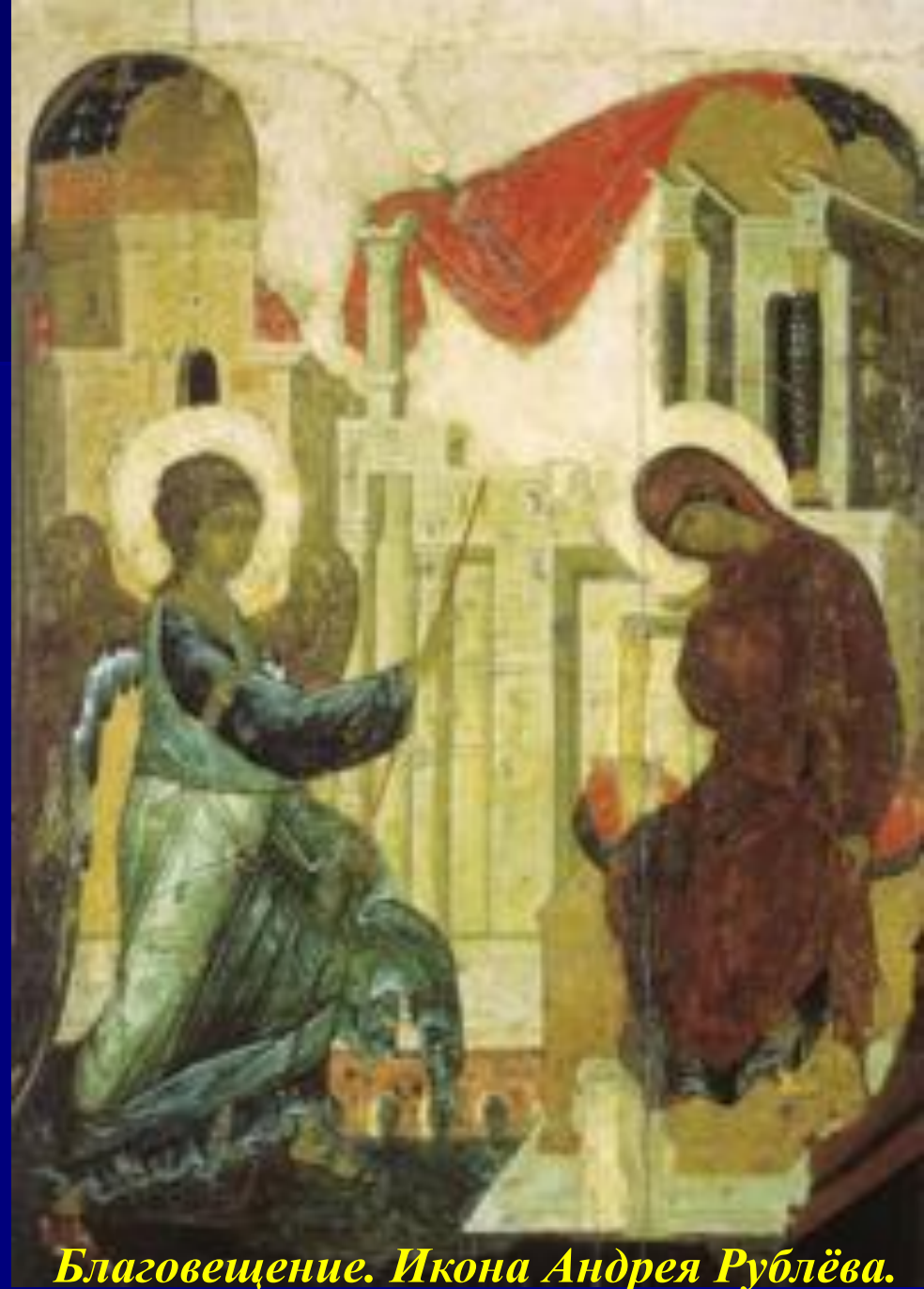
Благовещение. Икона Андрея Рублёва. 1427 – 1430. Андроников монастырь.

Посмотрим на икону праздника: ангел сходит к Деве, чтобы ей возвестить «Благую весть». Архангел Гавриил принес Деве Марии самую большую новость – Сын Божий становится Сыном человеческим. Исполняется пророчество Исаии, Богородица отвечает согласием на весть ангела: «Да будет мне по слову твоему». Без этого добровольного согласия Бог не мог бы стать человеком. Он не мог бы воплотиться, так как Бог не действует силой, не принуждает нас ни к чему. Человеку дана полная свобода ответить Богу согласием и любовью.