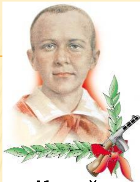
Марат Казей - Герой Советского Союза