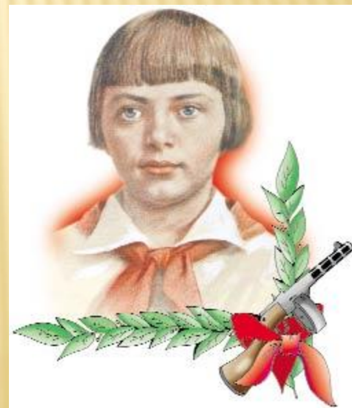
Зина Портнова – Герой Советского Союза