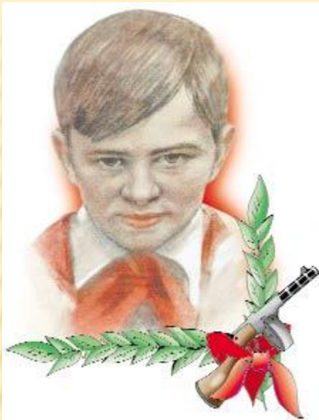
Валя Котик – Герой Советского Союза