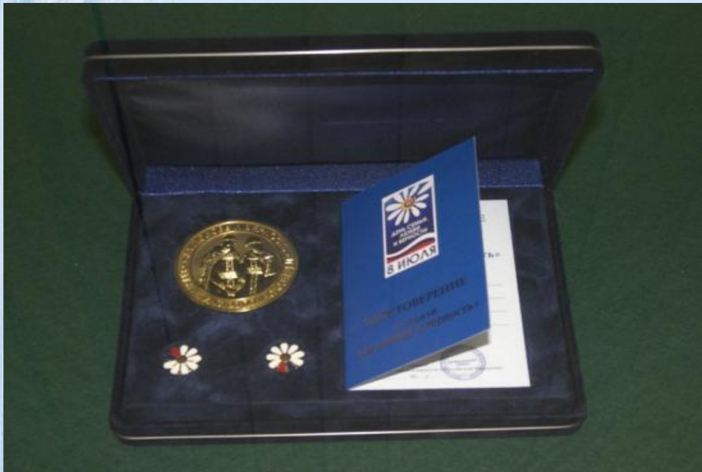
Памятная медаль Святых Петра и Февронии