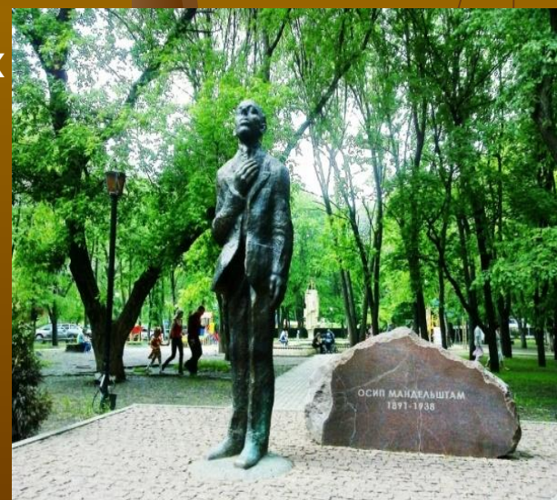
Памятник Осипу Мандельштаму в Воронеже