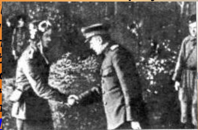
А.Новиков поздравляет Маресьева с присвоением звания Героя Советского Союза

20 июля 1943 года Алексей Маресьев во время воздушного боя с превосходящими силами противника спас жизни 2 советских лётчиков и сбил сразу два вражеских истребителя Fw.190, прикрывавших бомбардировщики Ju.87. Боевая слава о Маресьеве разнеслась по всей 15-й Воздушной армии и по всему фронту. В полк зачастили корреспонденты, среди них был будущий автор книги «Повесть о настоящем человеке» Борис Полевой . 20 июля 1943 года Алексей Маресьев во время воздушного боя с превосходящими силами противника спас жизни 2 советских лётчиков и сбил сразу два вражеских истребителя и бомбардировщики. Боевая слава о Маресьеве разнеслась по всей 15-й Воздушной армии и по всему фронту. В полк зачастили корреспонденты, среди них был будущий автор книги «Повесть о настоящем человеке» Борис Полевой . 24 августа 1943 года Маресьеву присвоено звание Героя Советского Союза за спасение жизни двух лётчиков и уничтожение двух вражеских истребителей и бомбардировщика.