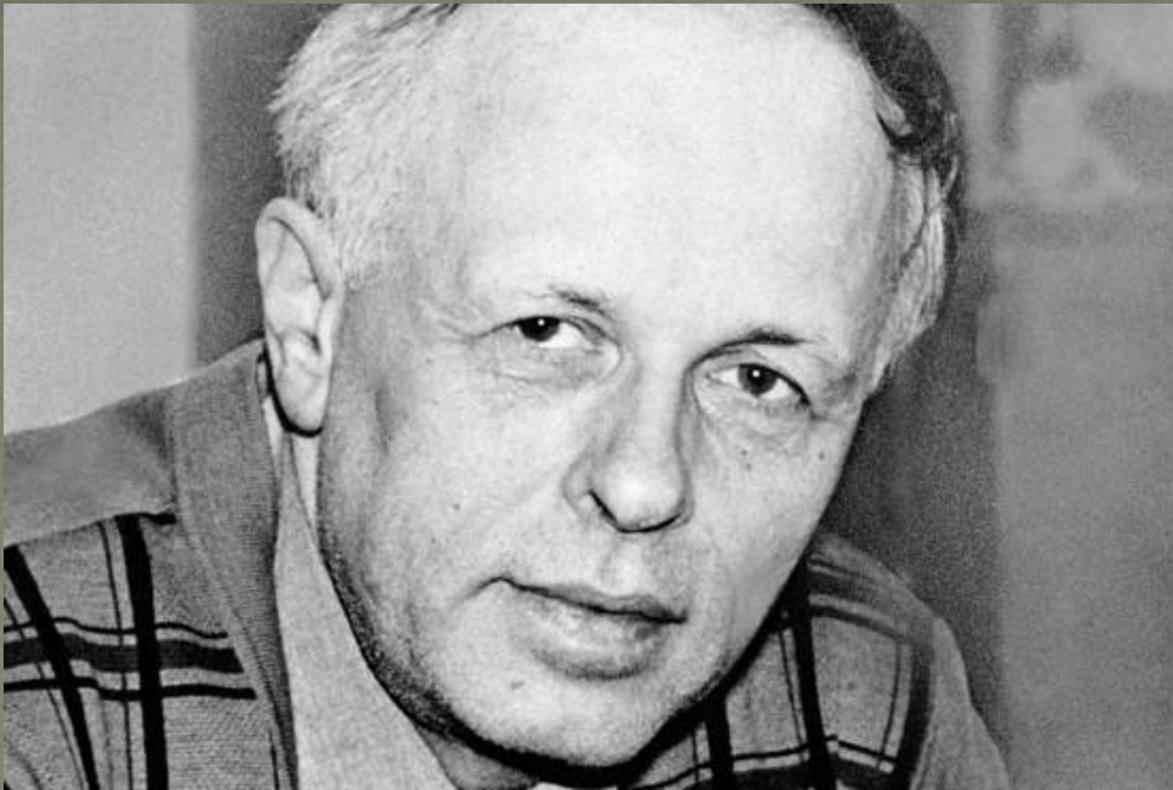
Андрей Дмитриевич Сахаров