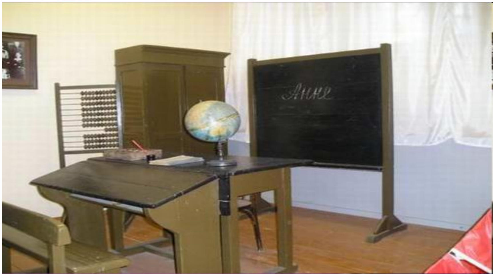
Парта, за которой учился А.Г. Николаев