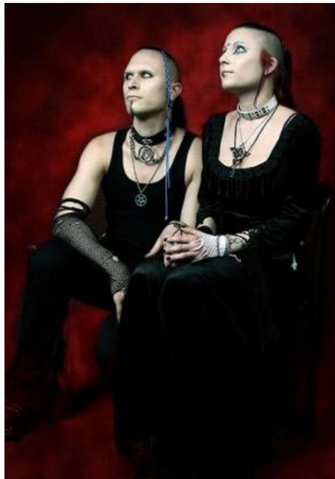
Androgyn Goth (бесполость)