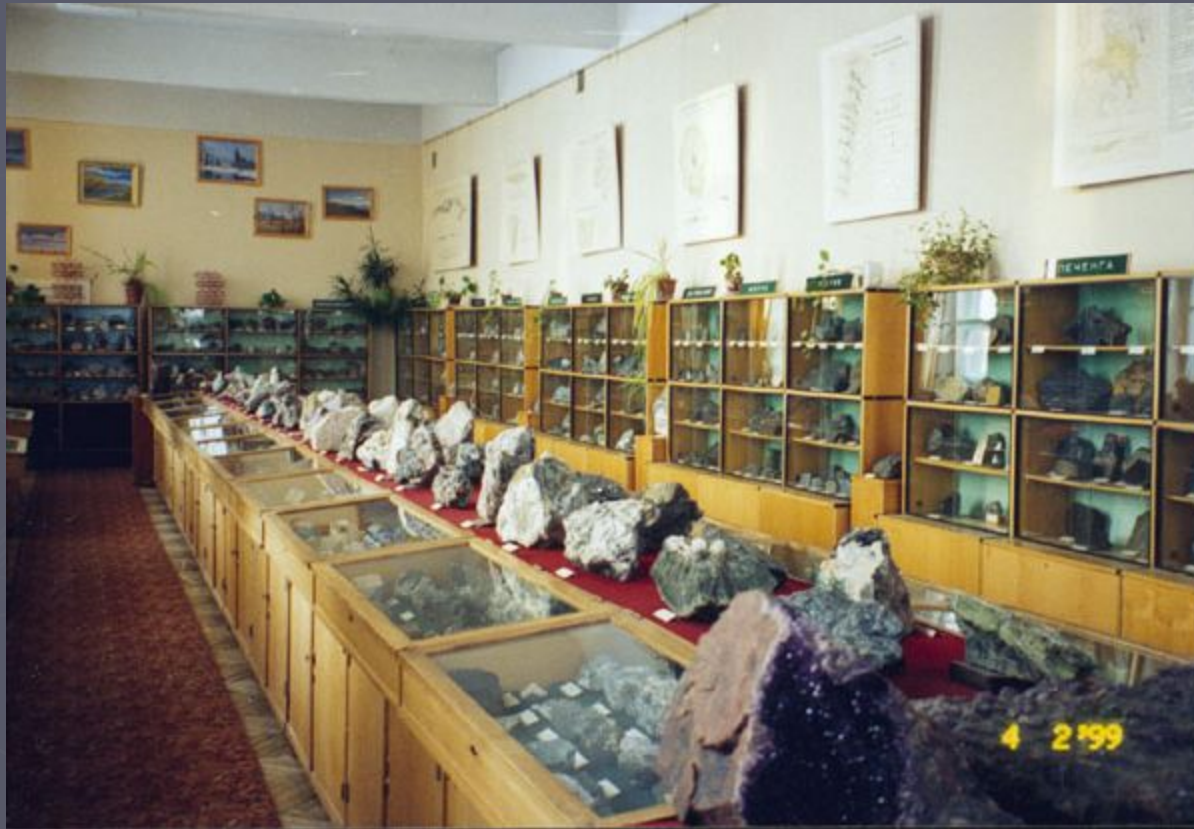
Минералогический музей геологического института Кольского научного центра РАН