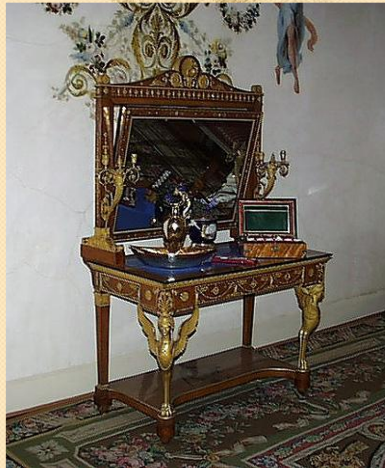
Туалетный стол с зеркалом «псише»