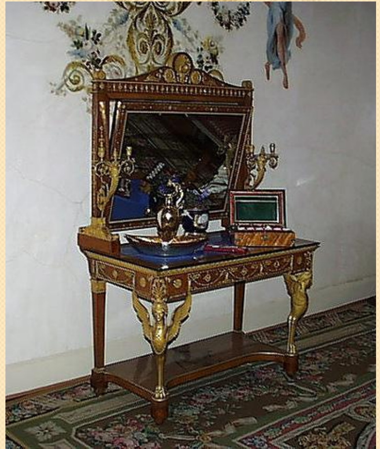
Туалетный стол с зеркалом «псише»