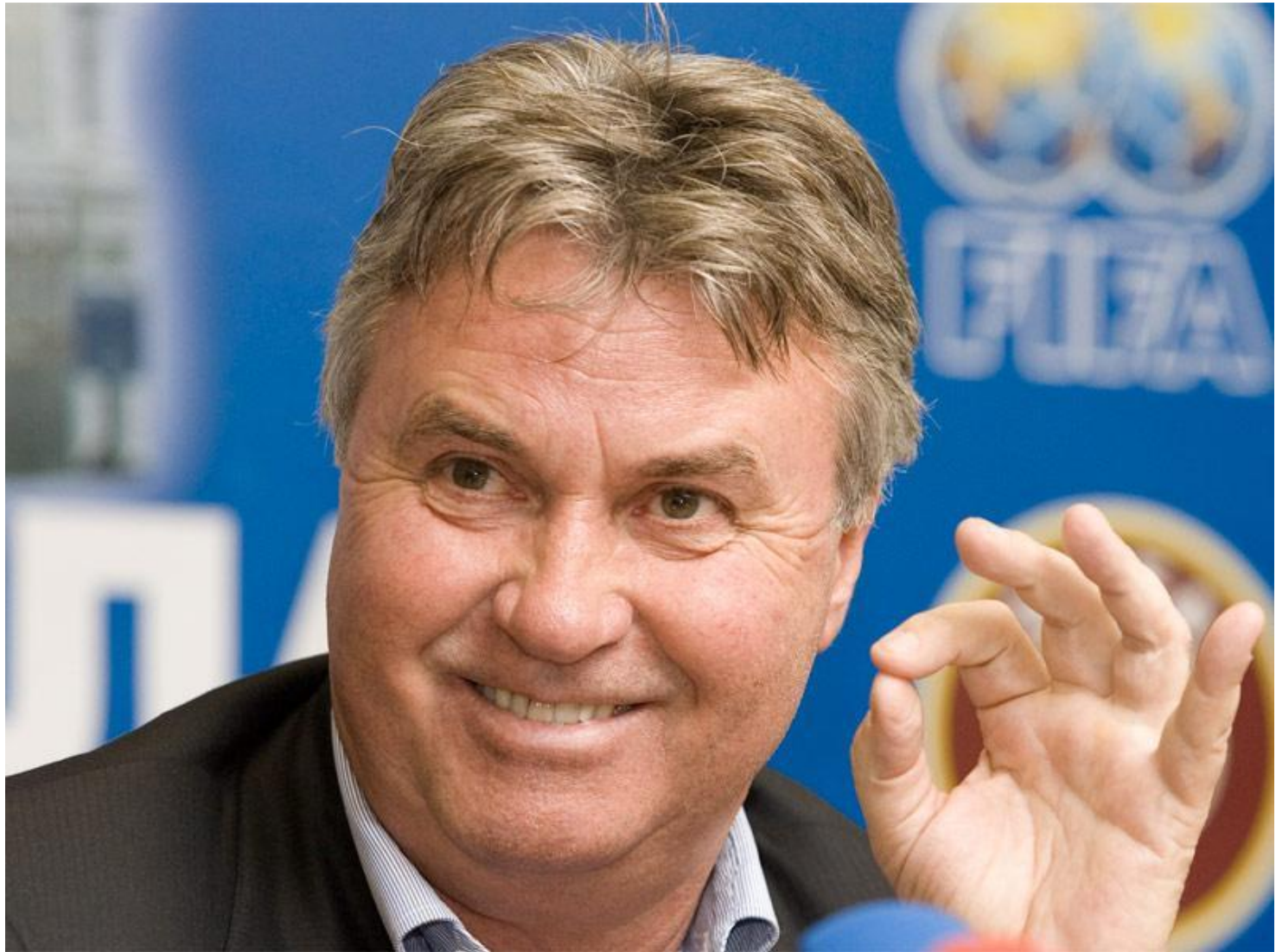
Гус Хиддинг – тренер сборной России с 2006 по 2010 гг.