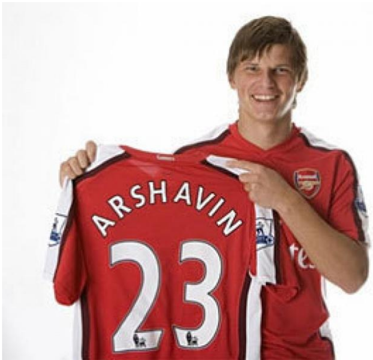
Российский футболист Андрей Аршавин