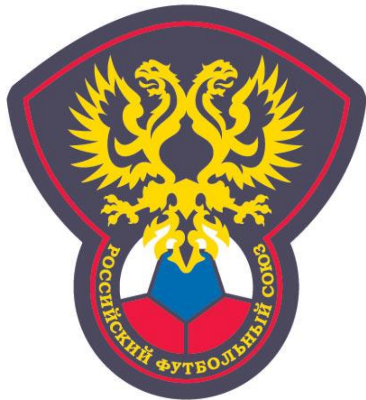
Герб Российского футбольного союза