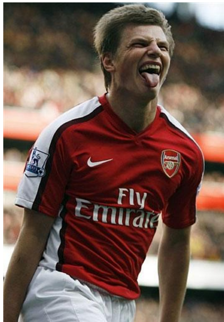
Российский футболист Андрей Аршавин в составе команды «Арсенал»