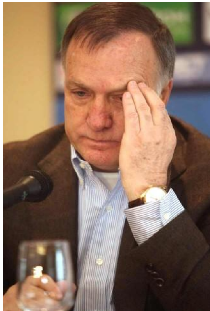
Дик Адвокат – тренер сборной России с 2010 г.