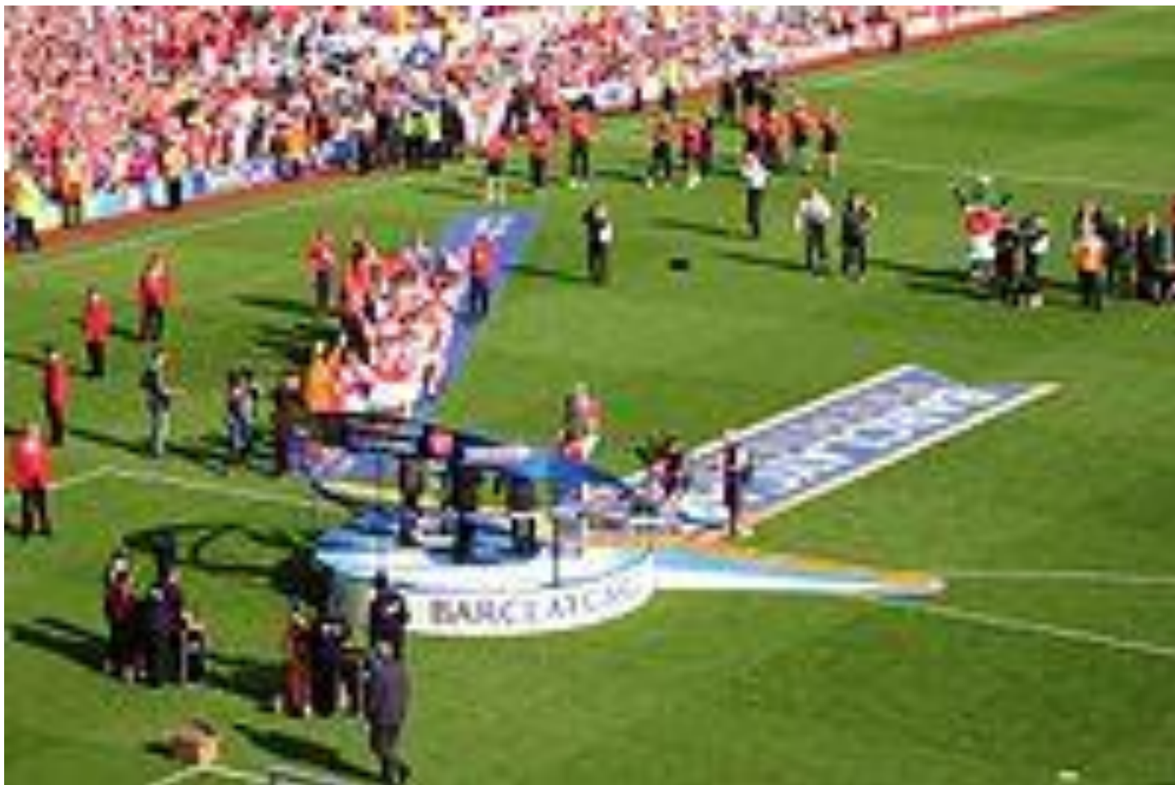
Капитан «Арсенала» Патрик Виейра поднимает кубок чемпионата английской Премьер-лиги 2003/04 г.