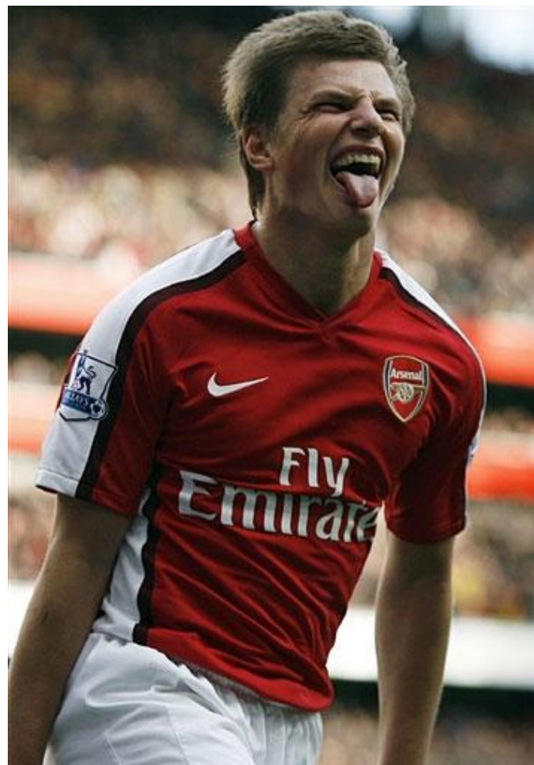
Российский футболист Андрей Аршавин в составе команды «Арсенал»