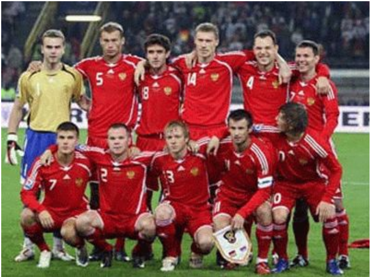
Молодежная сборная России по футболу