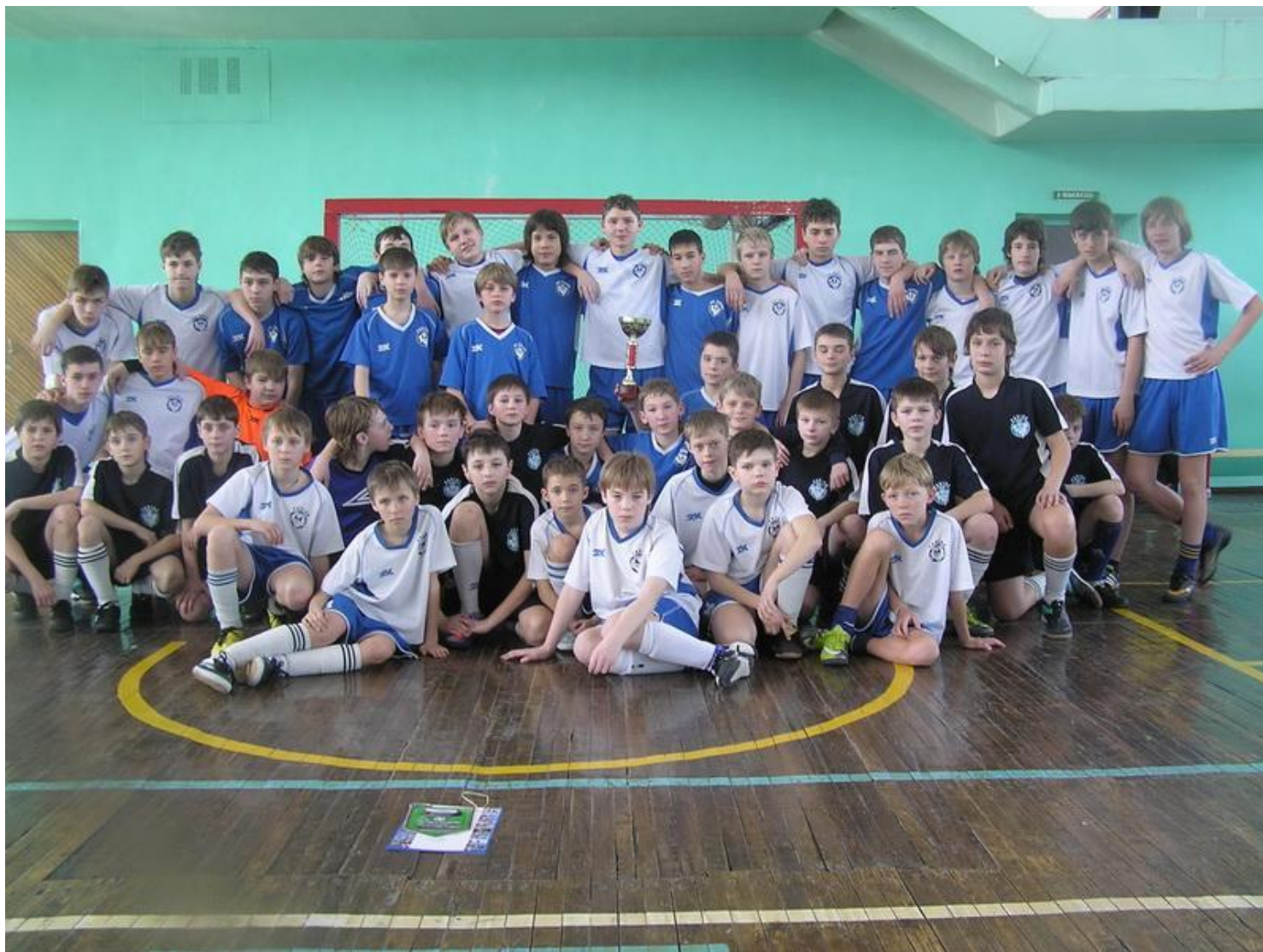
Футбольный клуб «Павино» г. Владивосток