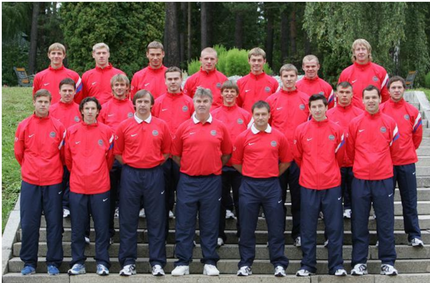
Сборная по футболу в 2010 г.