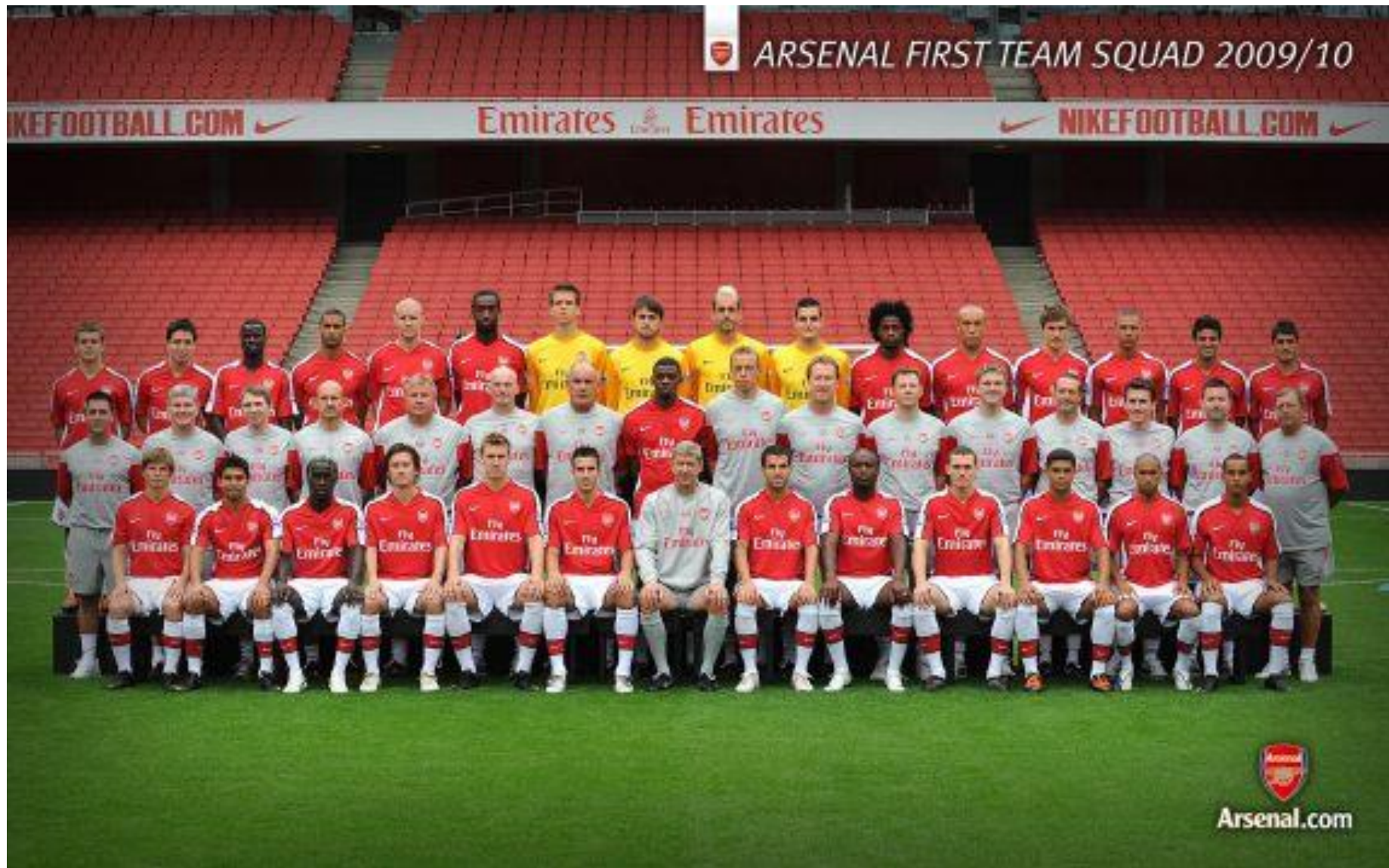
Общий состав клуба «Арсенал» в 2010 году