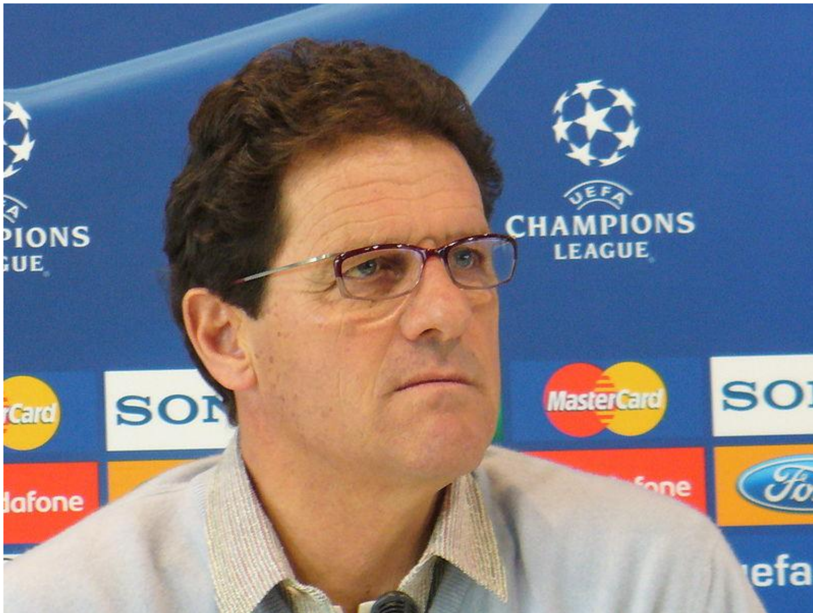
Итальянский футболист; главный тренер сборной Англи по футболу