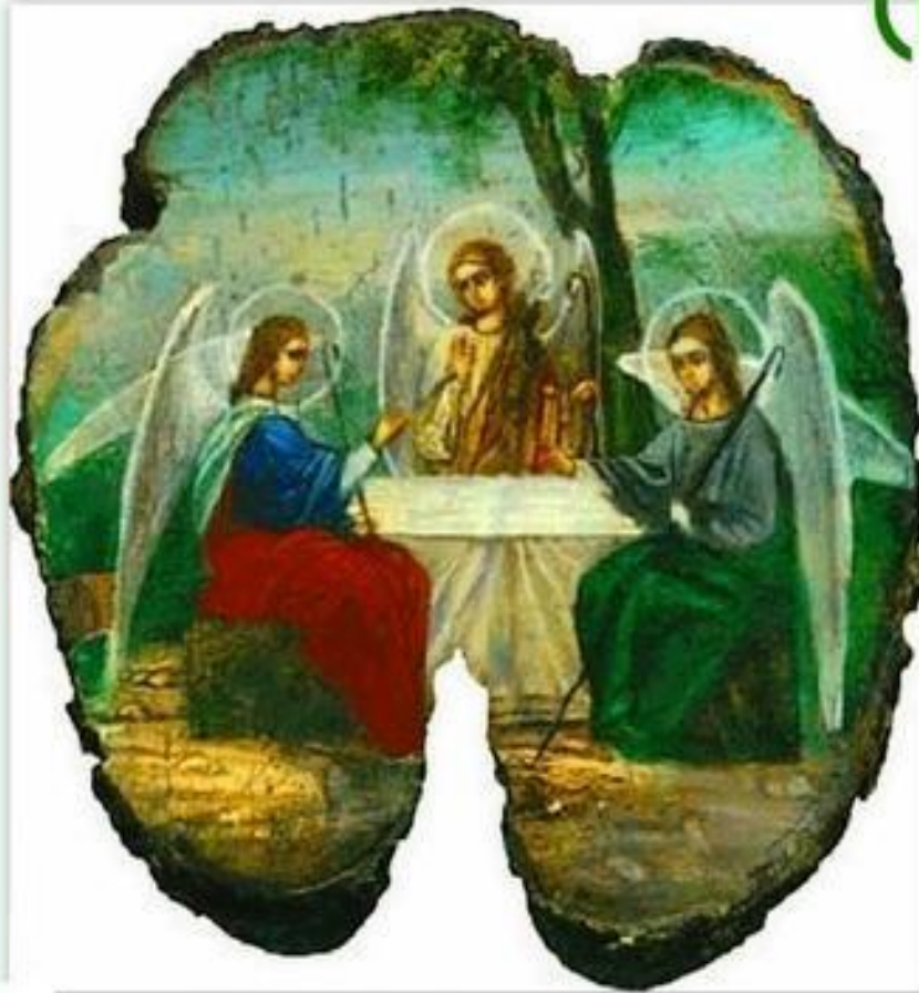
Троица. Афонская икона

СЁМУХА - ЭТО ЗАВЕРШАЮЩИЙ ВЕСЕННИЙ ПРАЗДНИК, СОВПАДАЮЩИЙ С ЦЕРКОВНЫМ ПРАЗДНИКОМ - ДНЁМ СЯТОЙ ТРОИЦЫ (ПЯТИДЕСЯТНИЦЕЙ - 50 ДНЕЙ ПОСЛЕ ПАСХИ)