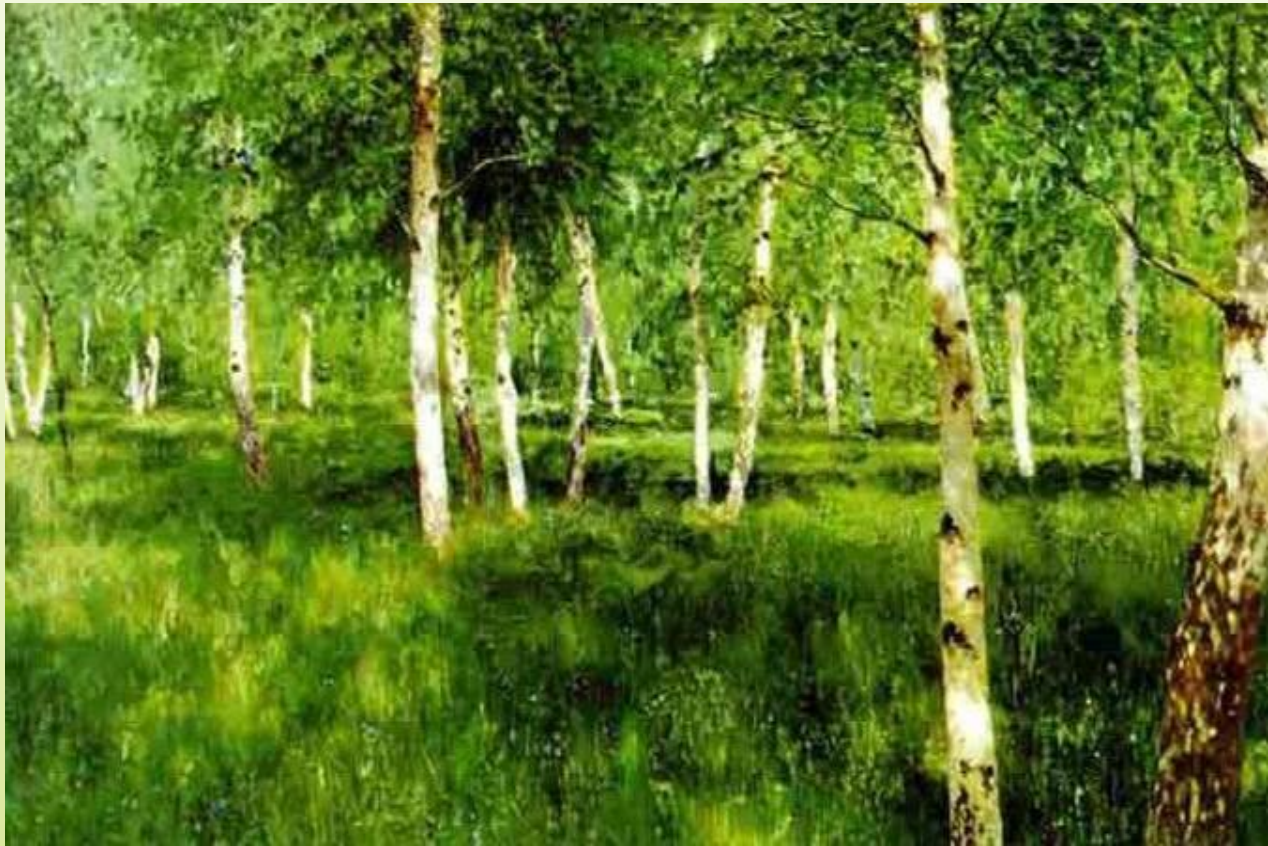
Левитан И. «Березовая роща»