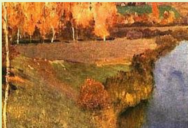
Левитан И. "ЗОЛОТАЯ ОСЕНЬ"