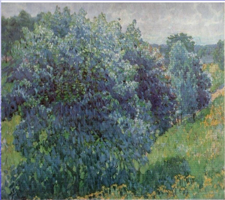
РЕПИН (1875—1938) «Мальчик с кустом», 1908 Темп. 71х107 Музей имени Гресько, Самарская область