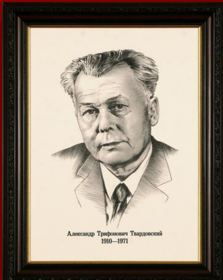
Александр Трифонович Твардовский 1910—1971