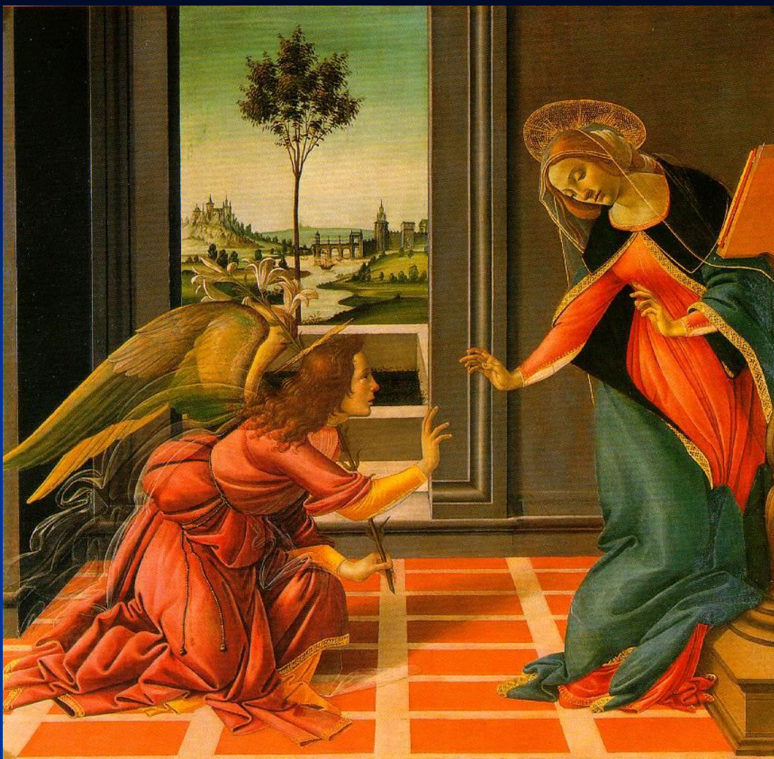
Боттичелли. Благовещение. 1489. Уффици. Флоренция