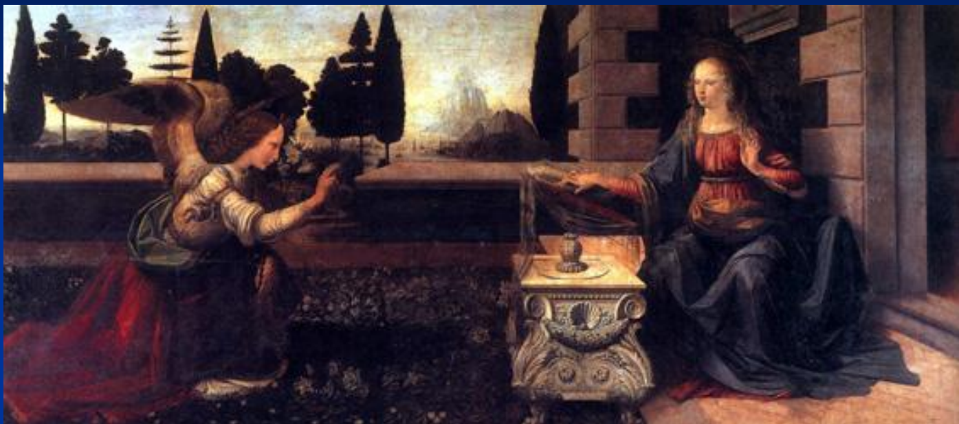
Леонардо Да Винчи. Благовещение. Уффици 1472-75