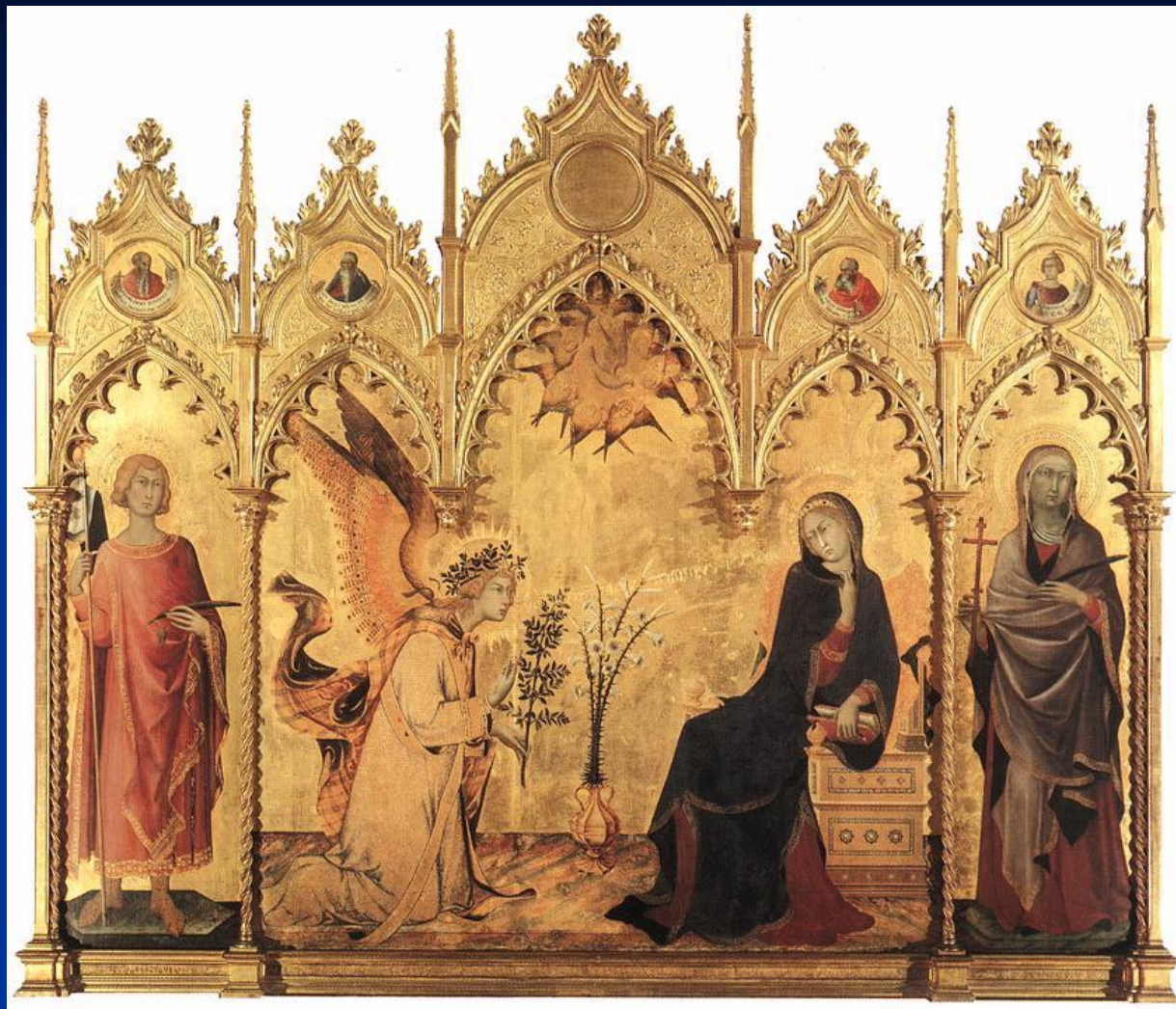
Симоне Мартини . Благовещение. 1333. Уффици, Флоренция