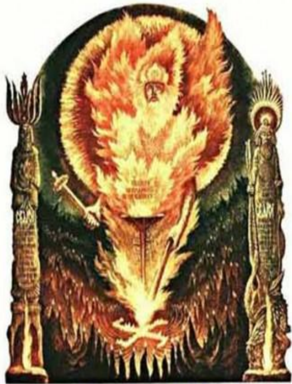
КОРЕНЬ ПРИБЛИЖИТЕЛИ, КОМУ ОТРУБЛАСЯ, И КОБАЧИТВО ЕГО УРАЖАНИЕ

Ярило — бог зерна, умирающего в земле, чтобы возродиться колосом, — был одновременно и прекрасным, и жестоким. Язычникам он представлялся юношей на белом коне, в белой одежде, в венке из полевых цветов, со снопом ржи в одной руке и отрубленной человеческой головой — в другой. Корень его имени — «яр» — встречается в словах, связанных с идеей плодородия и расцвета ЖИЗНИ: яровая пшеница; ярочка — молодая овца; но тот же корень означает гнев, пыл: яростный, ярый — сердитый или пылкий; яркий огонь. Яриле как богу смерти и воскресения приносилась в жертву молодая овца, кровью которой окропляли пашню, дабы сделать урожай более обильным.