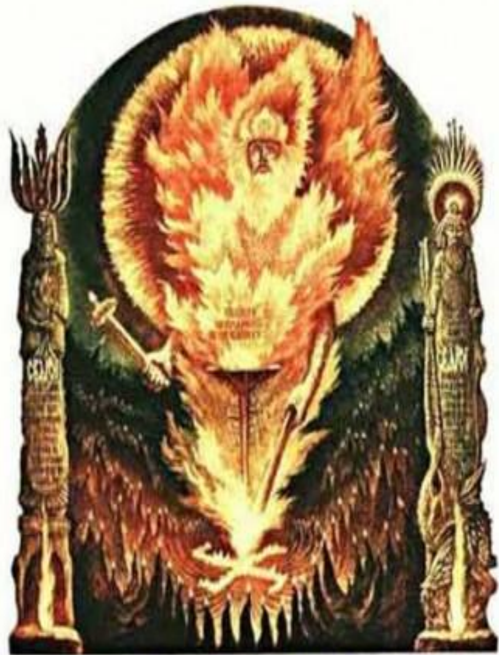
КОРЕНЬ ПРИБЛИЖИТЕЛИ, КОМУ ОТРУБЛАСЯ, И КОБАЧИТВО ЕГО УРАЖАНИЕ

Ярило — бог зерна, умирающего в земле, чтобы возродиться колосом, — был одновременно и прекрасным, и жестоким. Язычникам он представлялся юношей на белом коне, в белой одежде, в венке из полевых цветов, со снопом ржи в одной руке и отрубленной человеческой головой — в другой. Корень его имени — «яр» — встречается в словах, связанных с идеей плодородия и расцвета ЖИЗНИ: яровая пшеница; ярочка — молодая овца; но тот же корень означает гнев, пыл: яростный, ярый — сердитый или пылкий; яркий огонь. Яриле как богу смерти и воскресения приносилась в жертву молодая овца, кровью которой окропляли пашню, дабы сделать урожай более обильным.