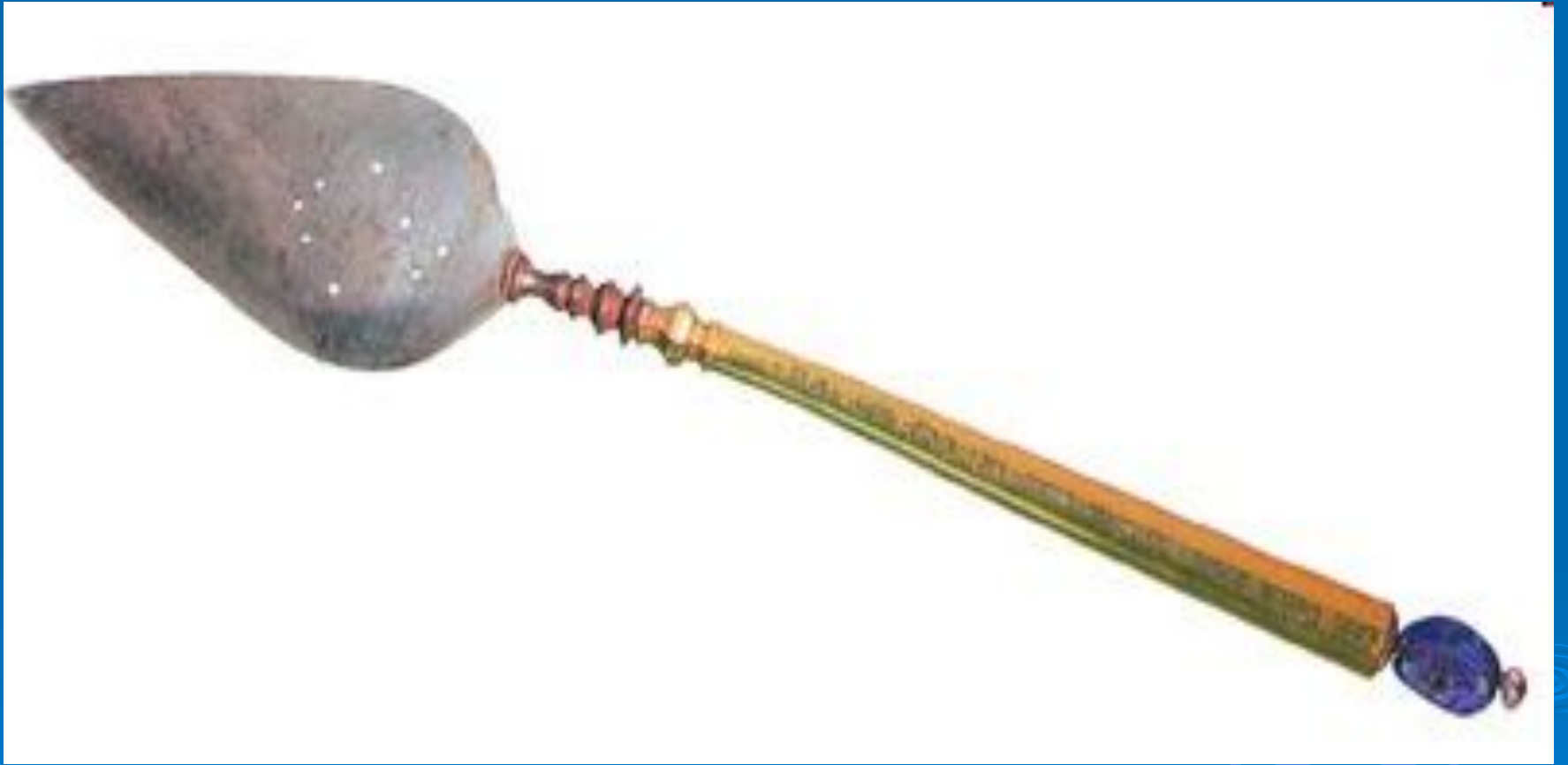
Копье. Россия. XVII в.