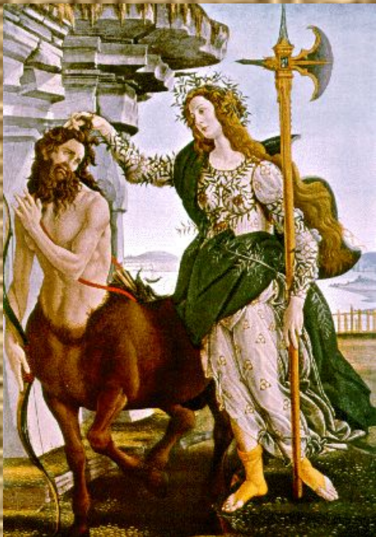
Афина Паллада и кентавр